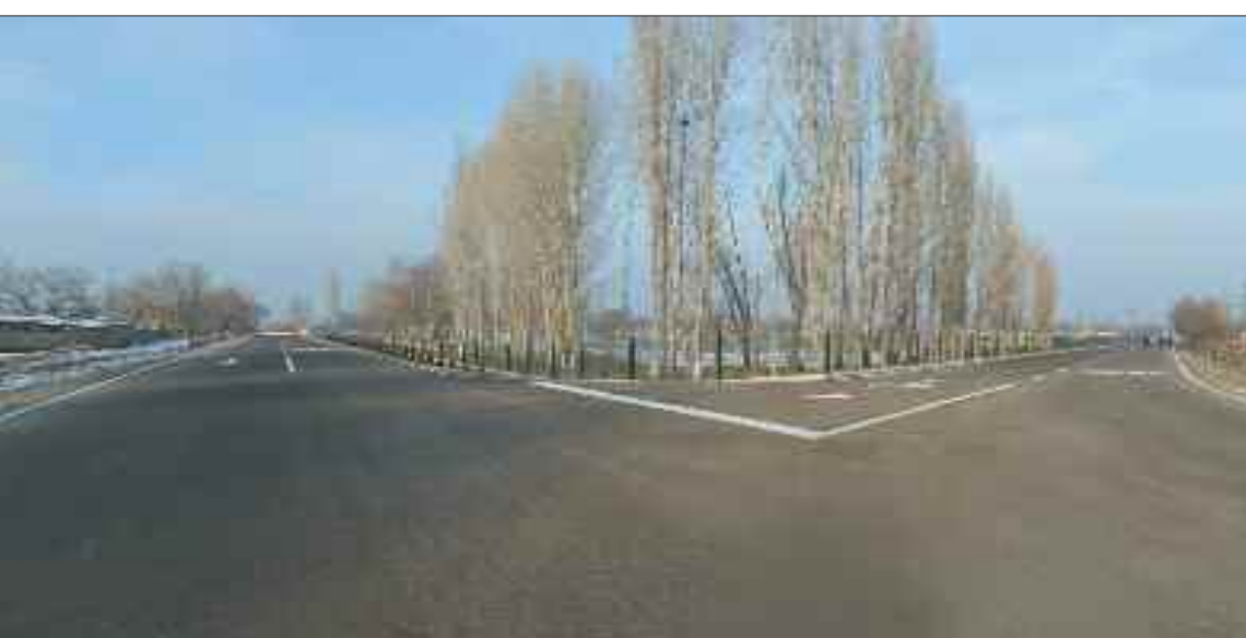
Naxçıvan şəhəri Qaraçuq kənd avtomobil yolu