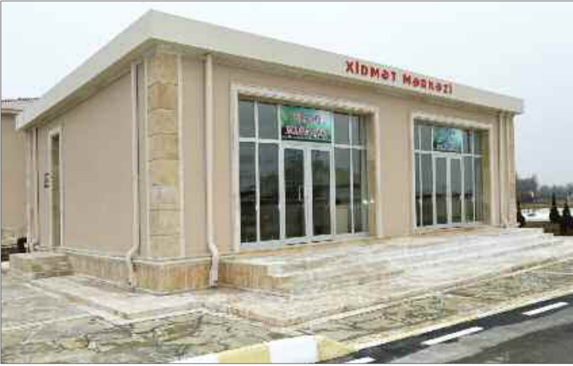
Şərur rayonunun Axaş kəndində xidmət mərkəzi