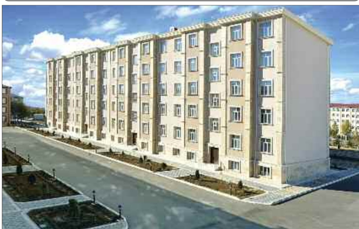
Naxçıvan şəhərində zabit ailələri üçün 68 mənzilli xidməti yaşayış binası