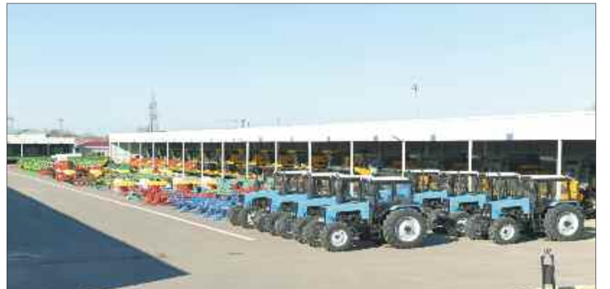
"Naxçıvan Aqrolizinq" Açıq Səhmdar Cəmiyyəti tərəfindən gətirilmiş yeni texnika və avadanlıqlar