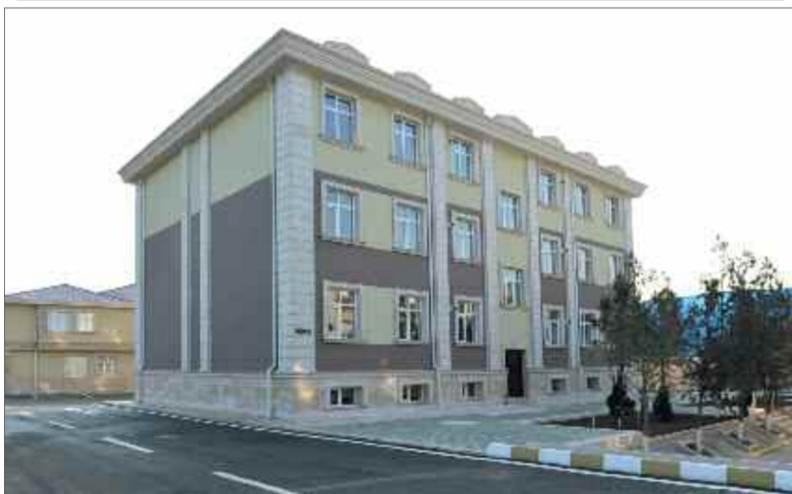
Naxçıvan şəhərinin Kazım Talıblı küçəsində 12 mənzilli yaşayış binası