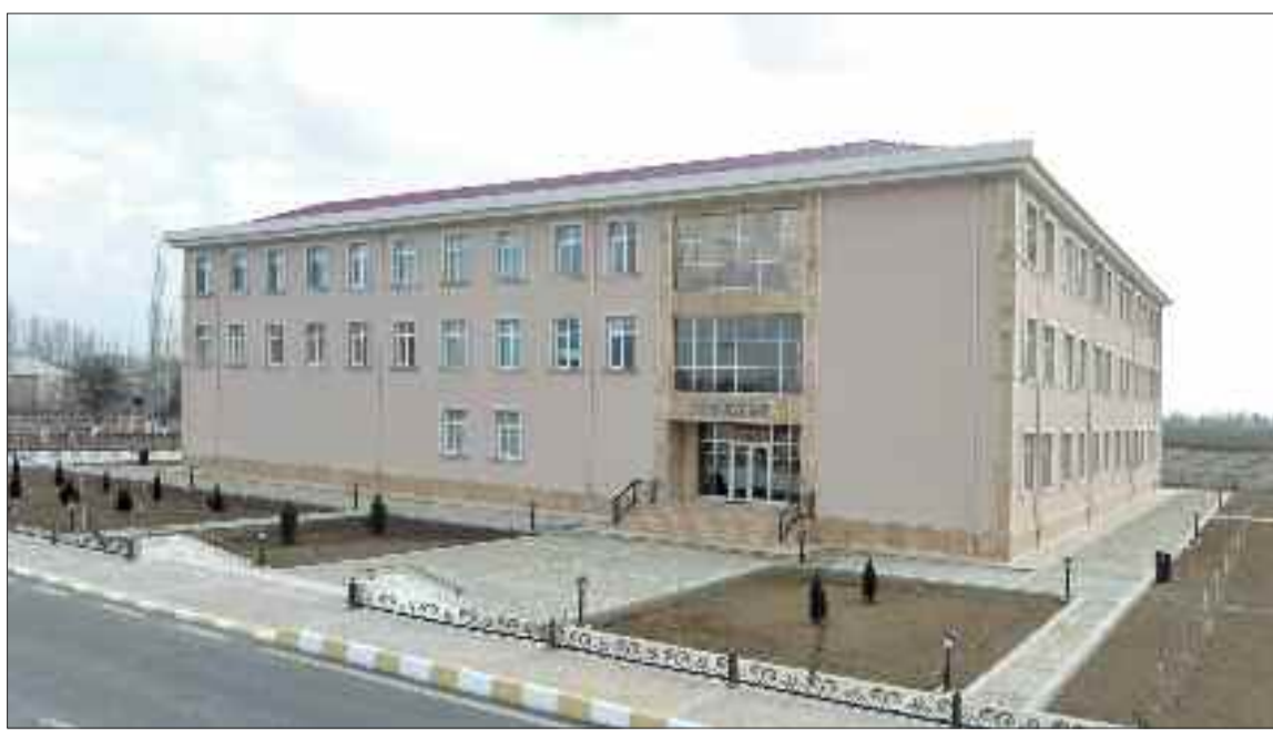
Şərur rayonundakı Kürkənddə 198 şagird yerlik tam orta məktəb