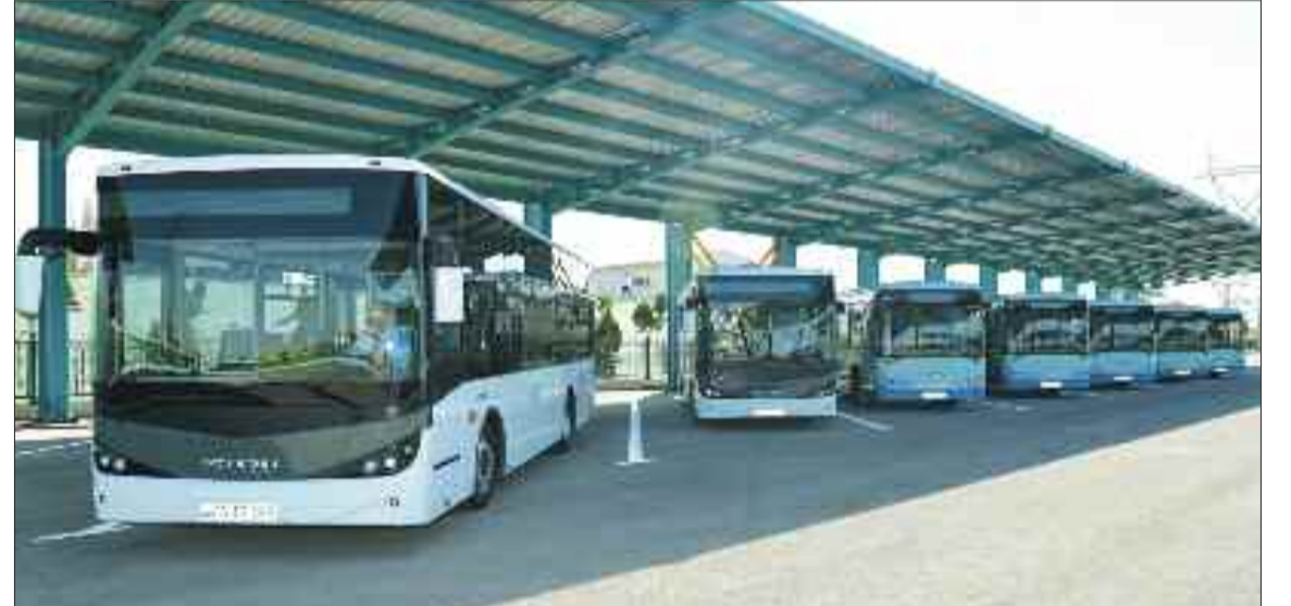
Naxçıvan Şəhər Nəqliyyat İdarəsinə təqdim olunmuş yeni avtobuslar