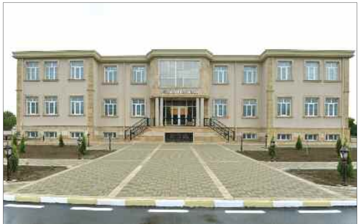
Sədərək Rayon Uşaq Musiqi Məktəbi