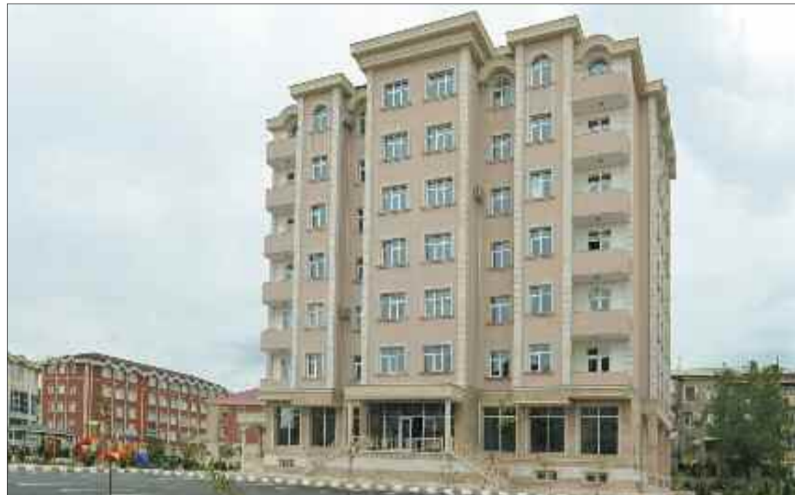
Naxçıvan şəhərinin "İstiqlal" küçəsində 30 mənzilli yaşayış binası