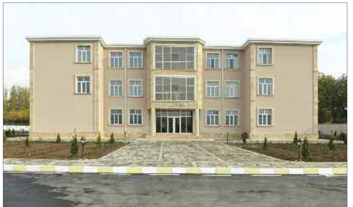
Culfa rayonunun Qızılca kəndində 120 şagird yerlik tam orta məktəb