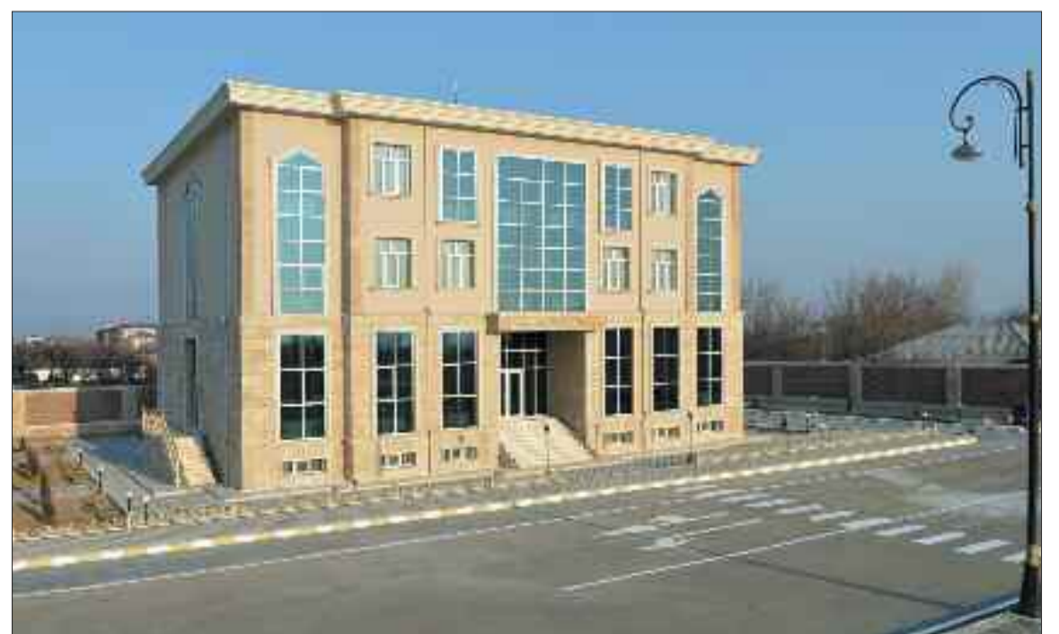
Babək Rayon Rabitə İdarəsi