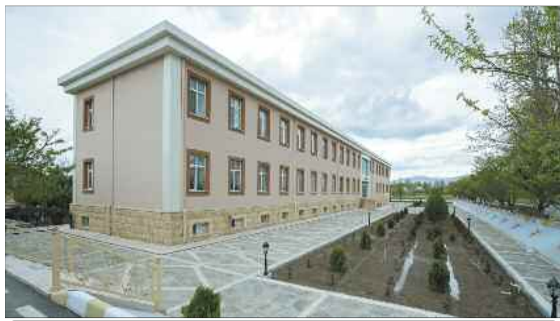
Şərur rayonundakı Cəlilkənddə 270 şagird yerlik tam orta məktəb