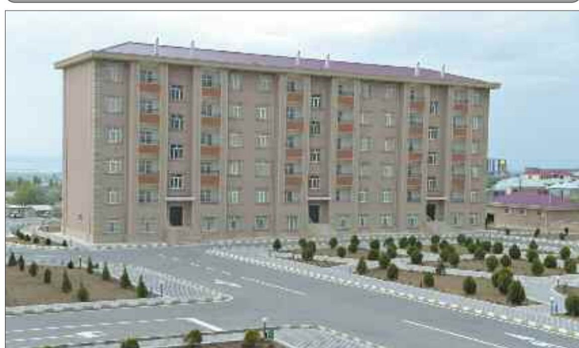
Naxçıvan şəhərində zabit-gizir ailələri üçün 45 mənzilli xidməti yaşayış binası