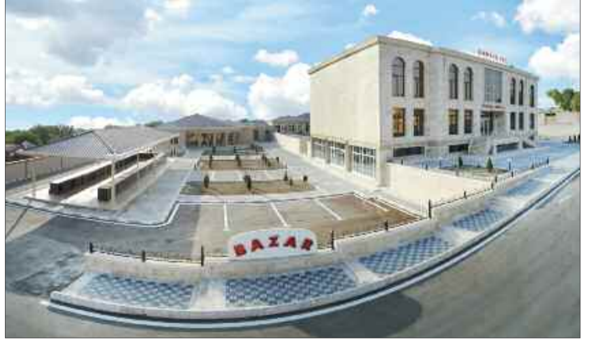
Kəngərli rayonunun Qıvraq qəsəbəsində yeni Ticarət-İaşə və Bazar Kompleksi