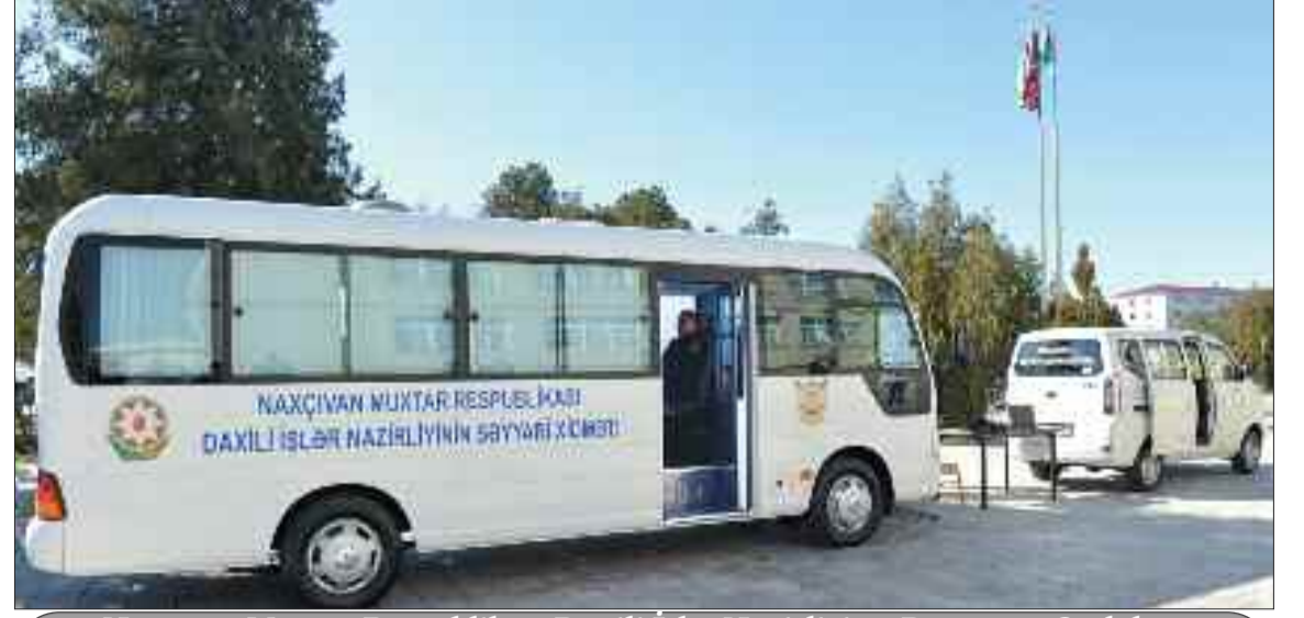
Naxçıvan Muxtar Respublikası Daxili İşlər Nazirliyinə, Daşınmaz Əmlak və Torpaq Məsələləri üzrə Dövlət Komitəsinə verilmiş sayğari xidmət avtomobilləri