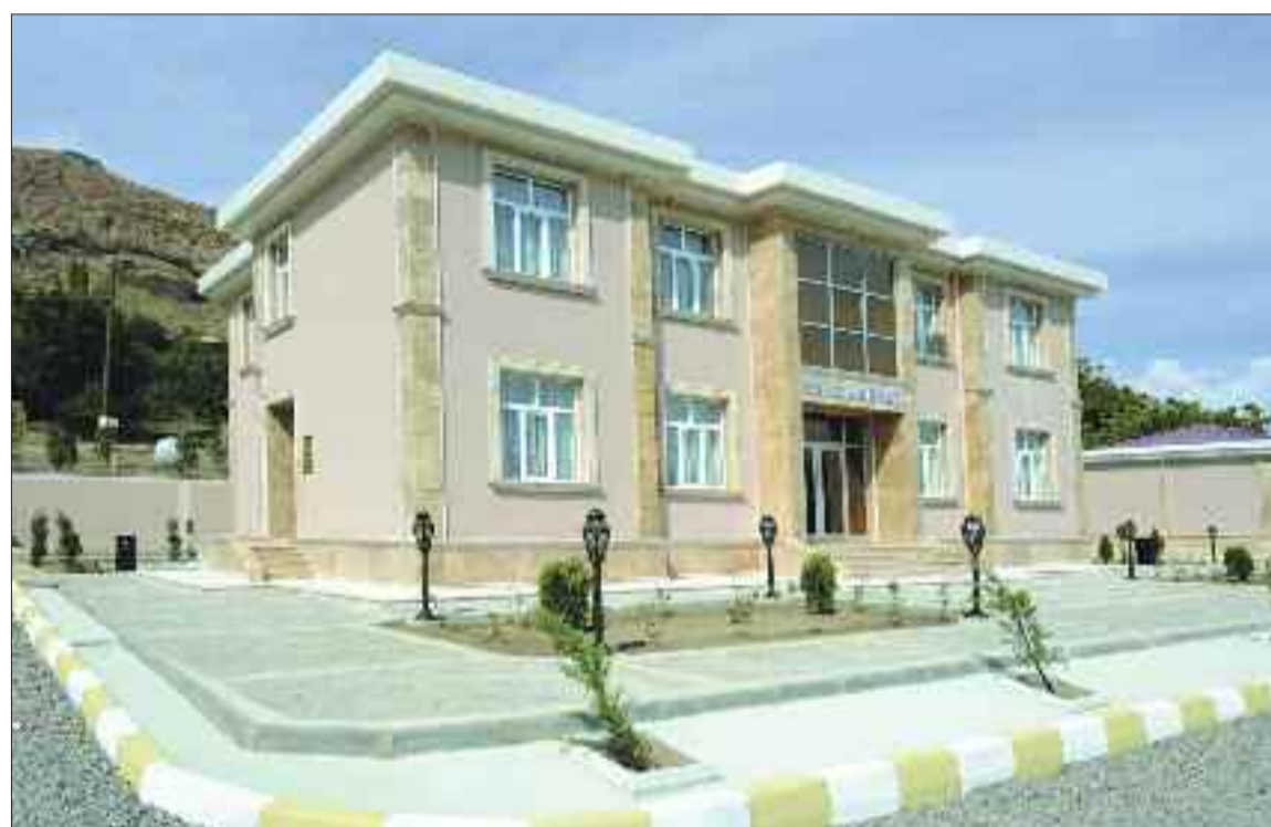
Culfa rayonu Gal Kənd Mərkəzi