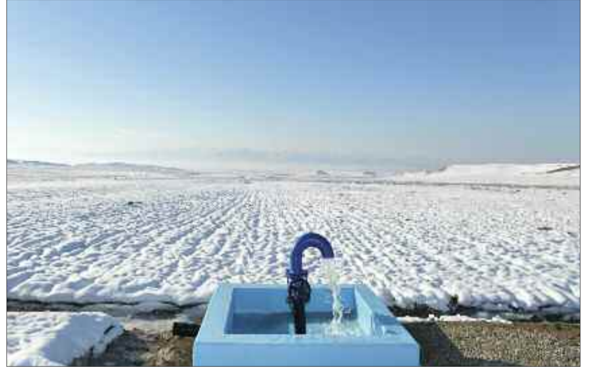
Vayxır sol sahil suvarma və drenaj şəbəkəsi