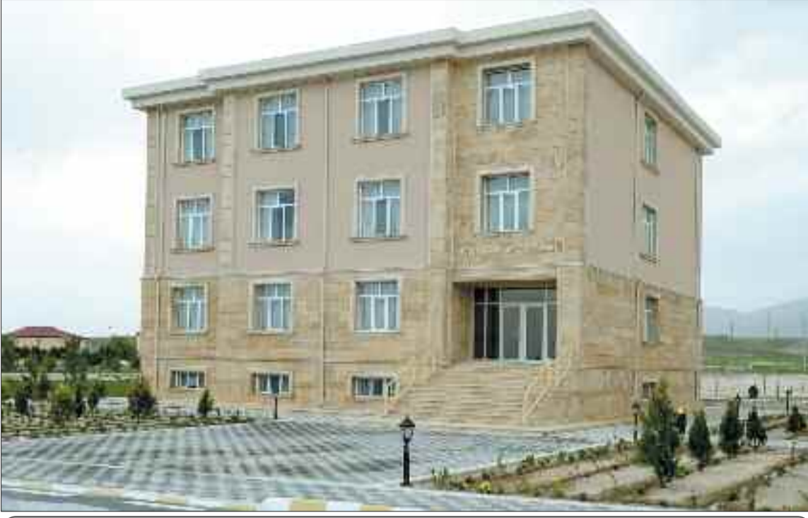
Kəngərli Rayon Uşaq-Gənclər Şahmat Məktəbi