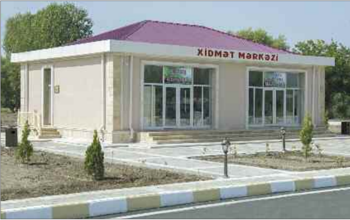
Şərur rayonunun Kürçülü kəndində xidmət mərkəzi