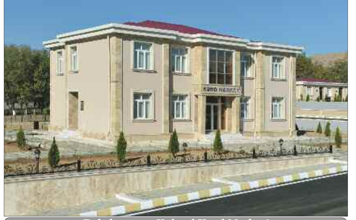
Babək rayonu Xal-xal Kənd Mərkəzi