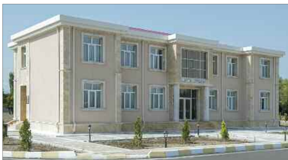
Şərur rayonu Kürçülü Kənd Mərkəzi