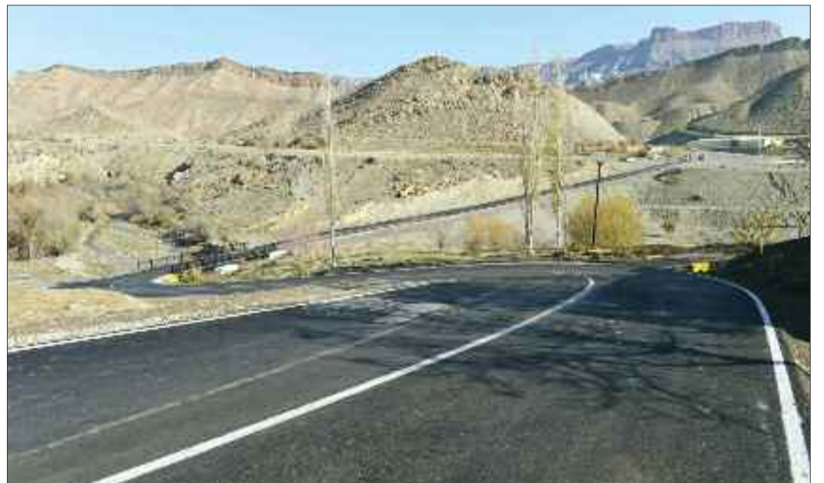
Ordubad rayonu Gilançay kənd avtomobil yolu