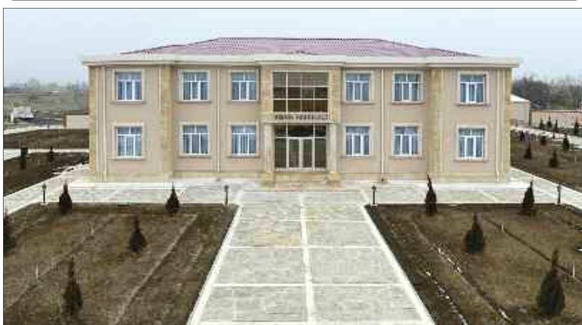
Şərur rayonu Axaməd Kənd Mərkəzi