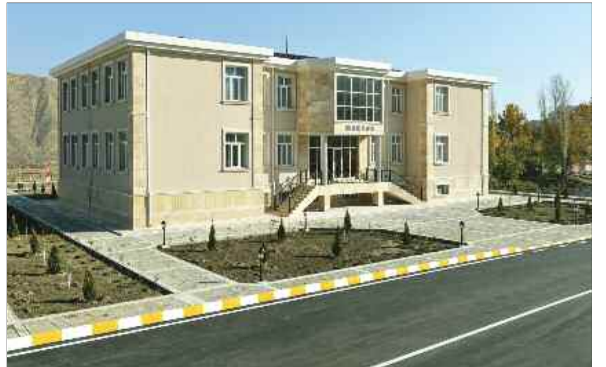
Ordubad rayonunun Gilançay kəndində 96 şagird yerlik tam orta məktəb