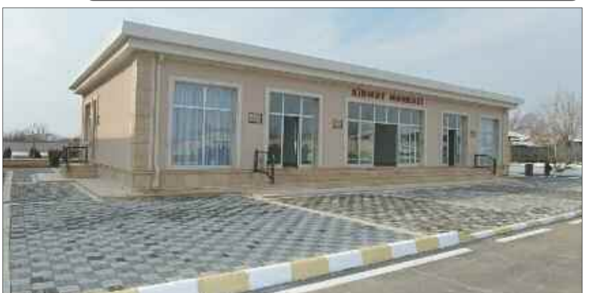
Naxçıvan şəhərinin Qaraçuq kəndində xidmət mərkəzi