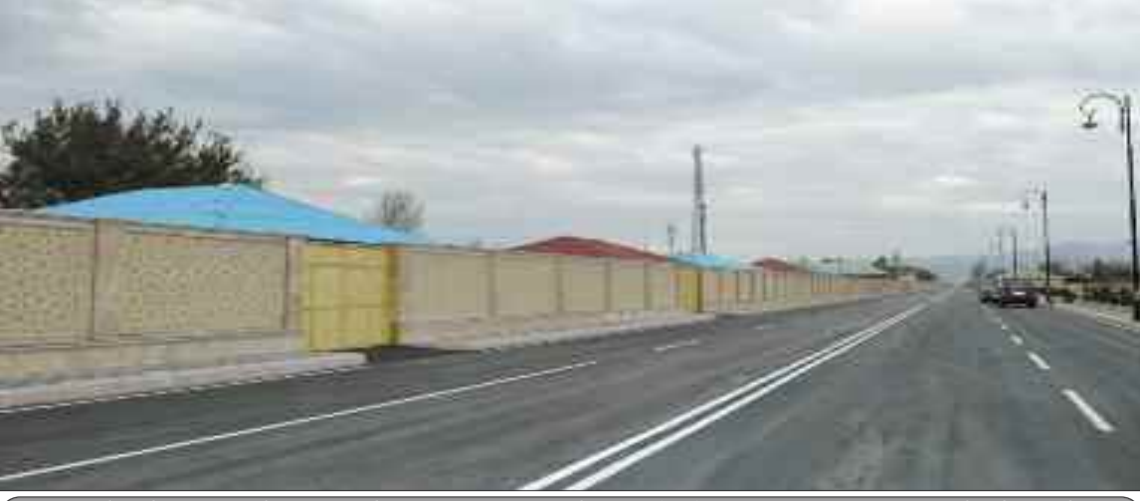
Babək qəsəbə-Nehrəm-Arazkənd dairəvi avtomobil yolu