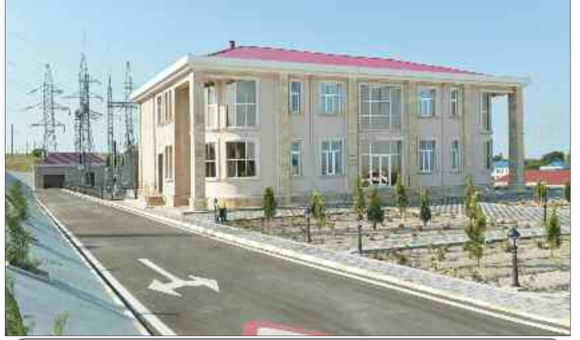
Kəngərli Rayon Elektrik Şəbəkəsinin inzibati binası və "Qıvraq" yarımstansiyası