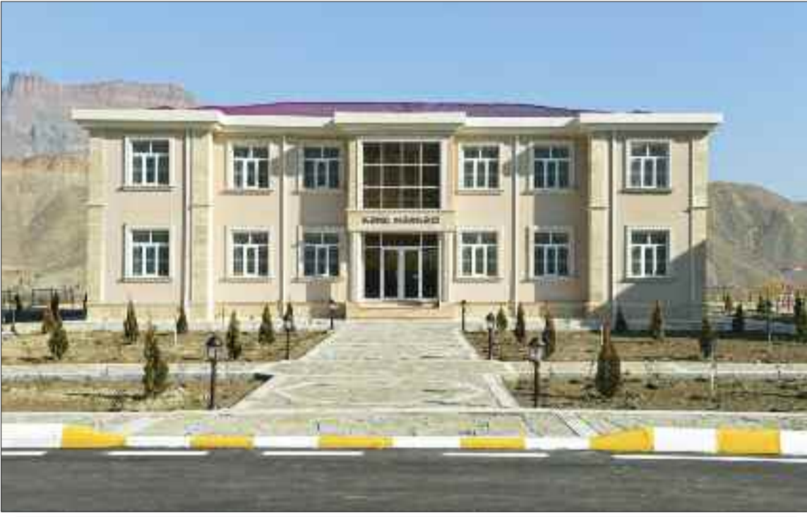
Ordubad rayonu Gilançay Kənd Mərkəzi