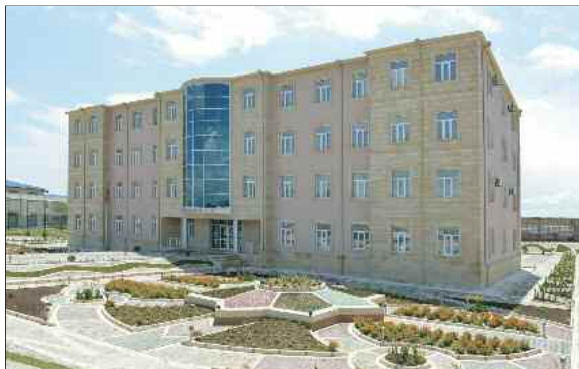
Naxçıvan şəhərindəki hərbi hissədə qərargah binası