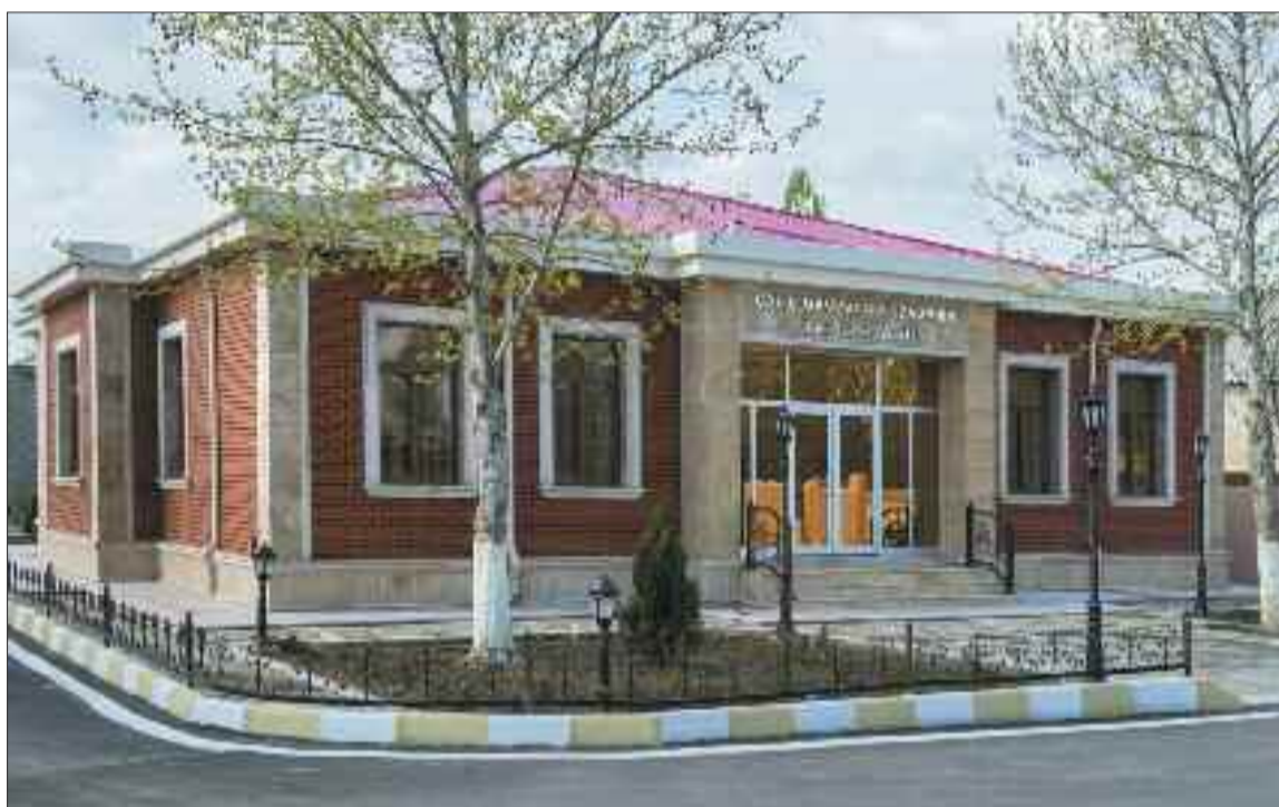
Şərur rayonundakı Çalilkənddə Cəlil Məmmədquluzadənin Xatirə Muzeyi