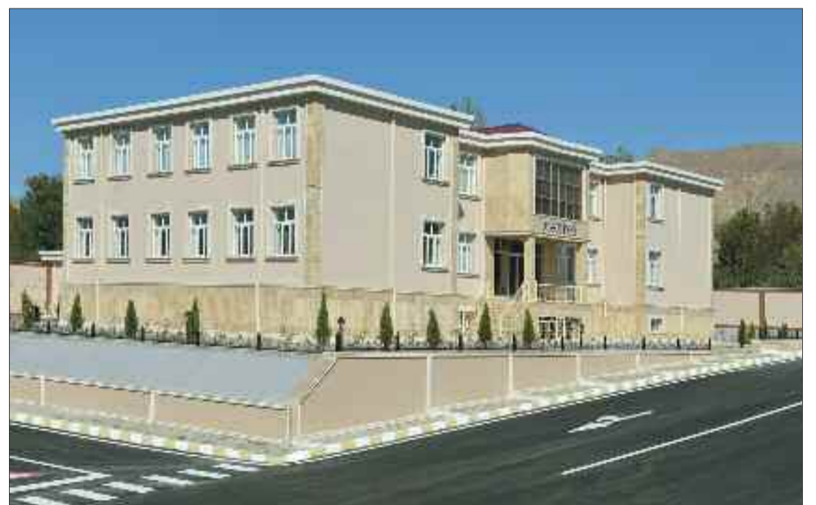
Babək rayonunun Xal-xal kəndində 192 şagird yerlik tam orta məktəb