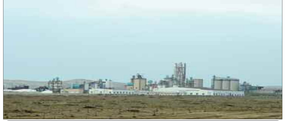
Naxçıvan Sənaye Kompleksi