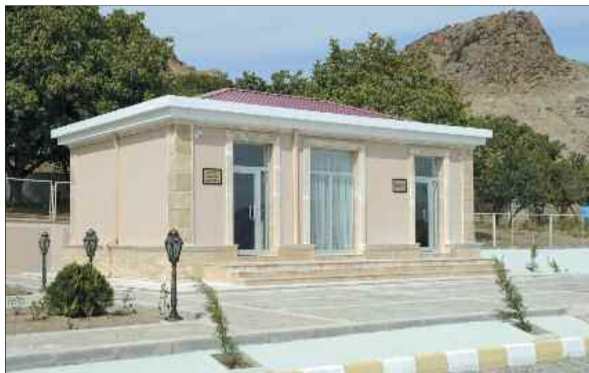
Culfa rayonunun Gal kəndində xidmət mərkəzi