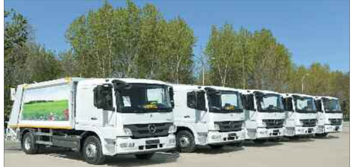
Muxtar respublikaya gətirilmiş yeni kommunal təyinatlı avtomobillər