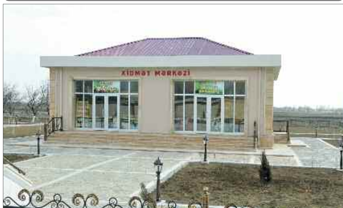
Şərur rayonundakı Kürkənddə xidmət mərkəzi