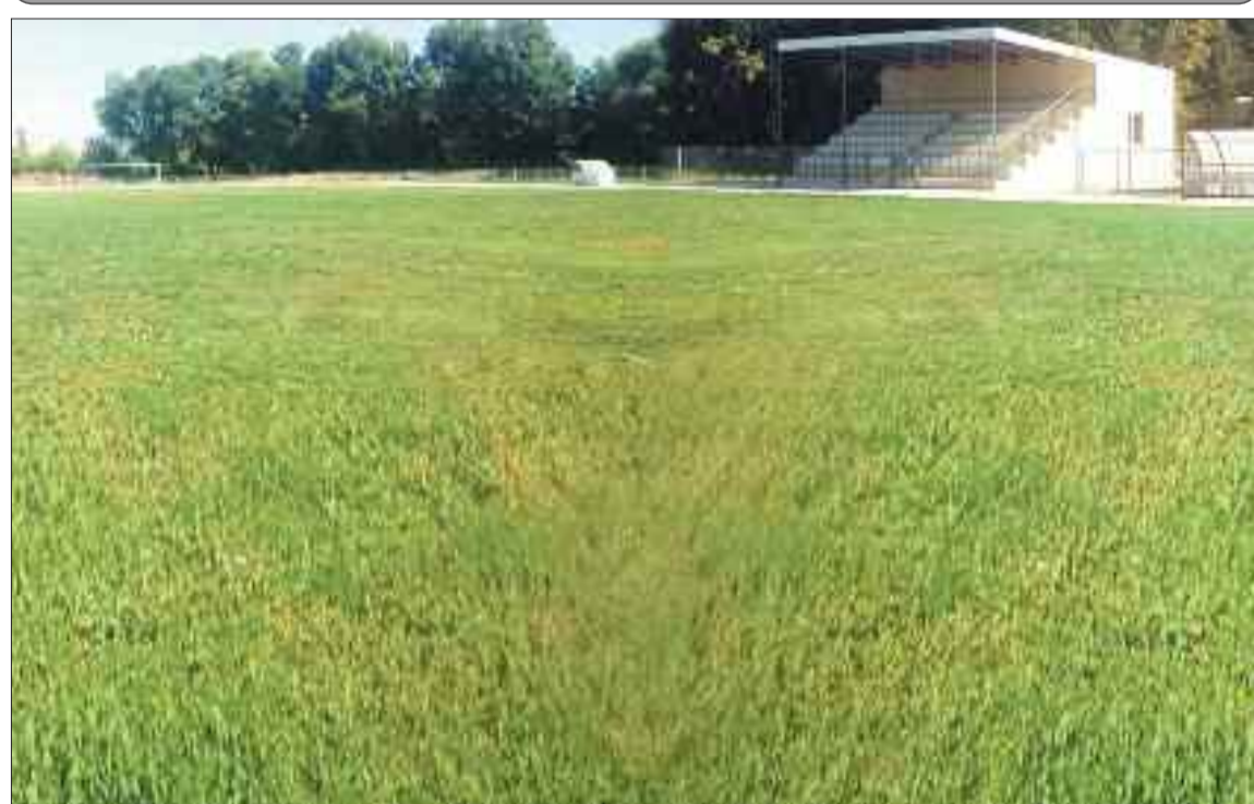
Şərur rayonunun Yuxarı Aralıq kəndində stadion