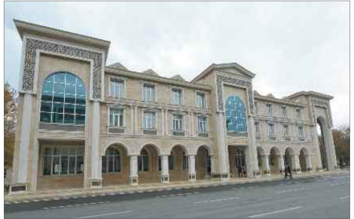
Naxçıvan şəhərində 2 saylı uşaq musiqi məktəbi