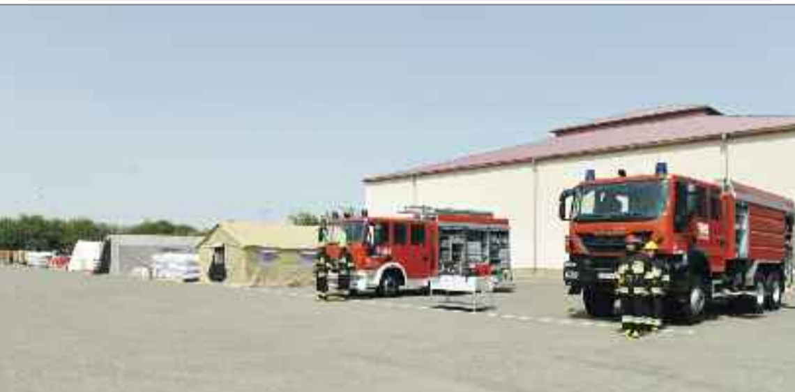
Naxçıvan Muxtar Respublikası Fövqəladə Hallar Nazirliyinə gətirilmiş yeni yangınsöndürən avtomobillər və səfərbərlik ehtiyatları