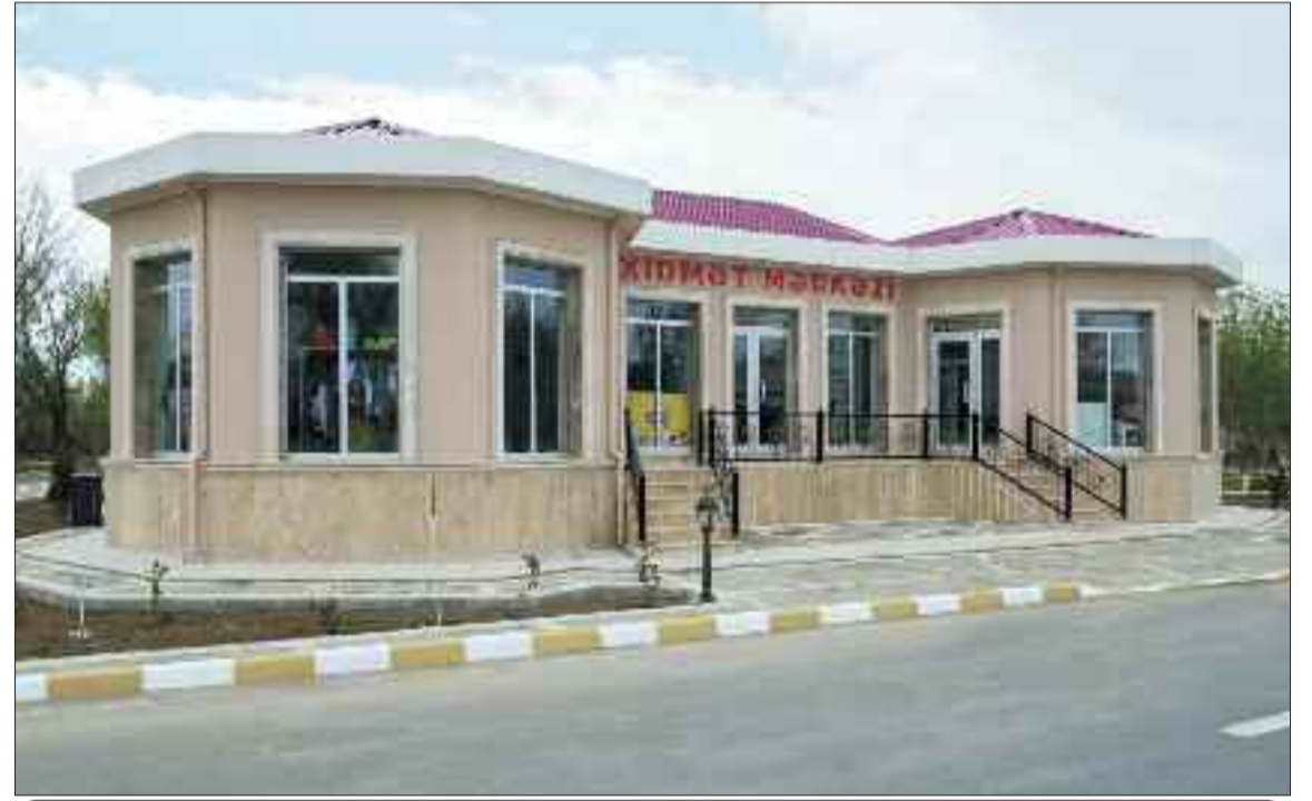
Şərur rayonundakı Cəlilkənddə xidmət mərkəzi