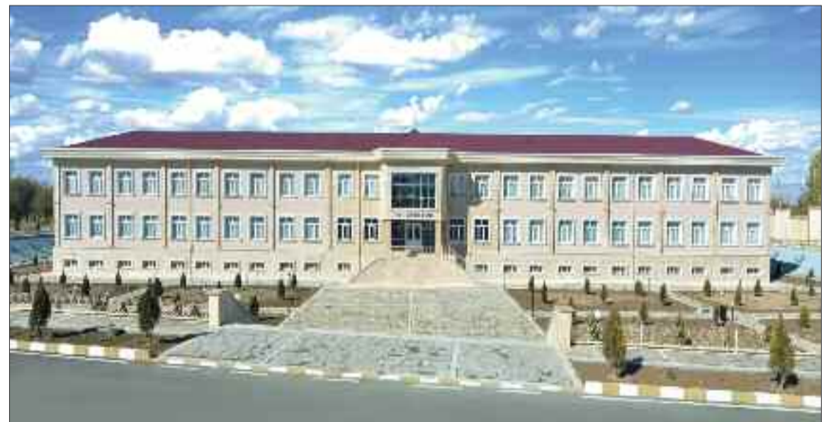
Babək rayonunun Nəhrəm kəndində 990 şagird yerlik 2 saylı tam orta məktəb