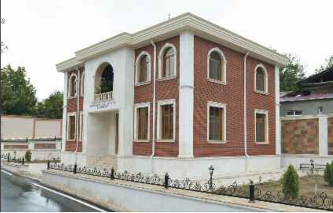
Ordubad şəhərində Məhəmməd Tağı Sidqinin ev-muzeyi