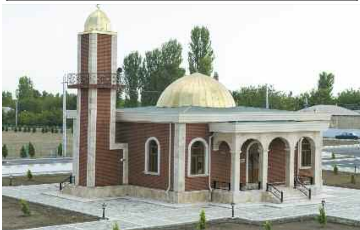
Şərur rayonundakı Kürkənddə məscid