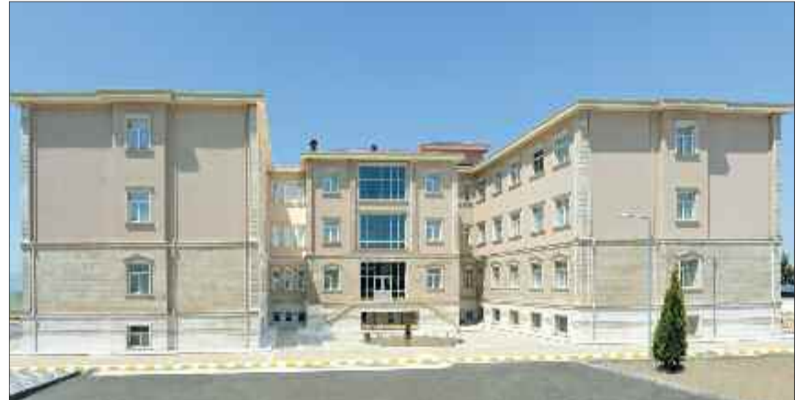
Naxçıvan Muxtar Respublikası Yoluxucu Xəstəliklər Mərkəzi