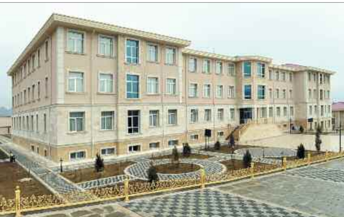
Ordubad şəhərində 810 şagird yerlik 3 nömrəli tam orta məktəb