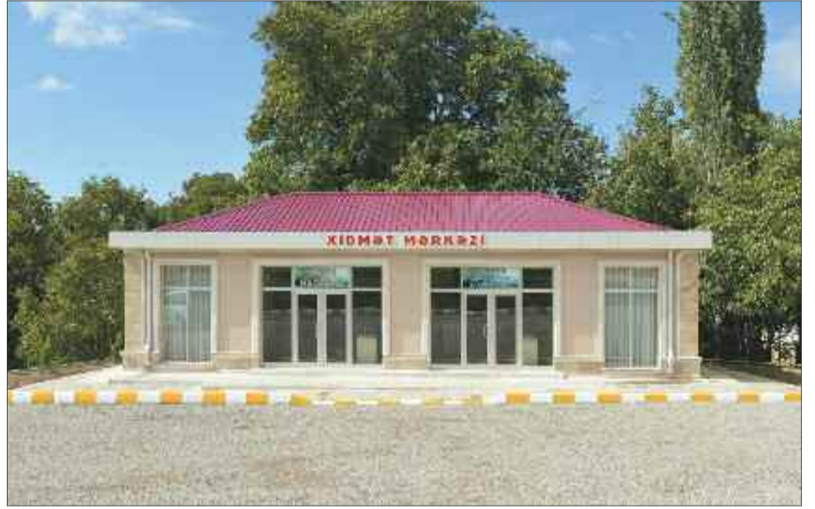
Ordubad rayonunun Tivi kəndində xidmət mərkəzi