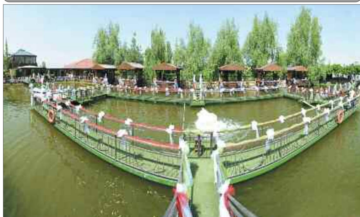
Naxçıvan şəhərində "Nuh yurdu" restoranı