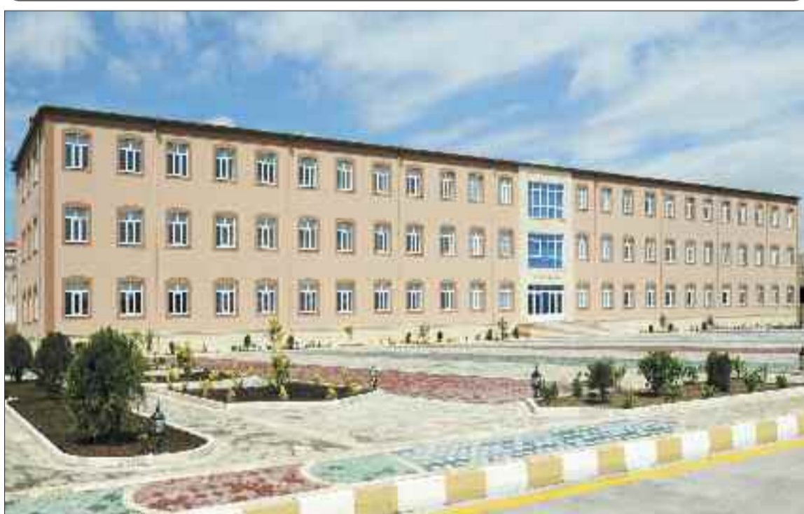
Naxçıvan şəhərindəki hərbi hissədə 900 yerlik əsgər yataqxanası