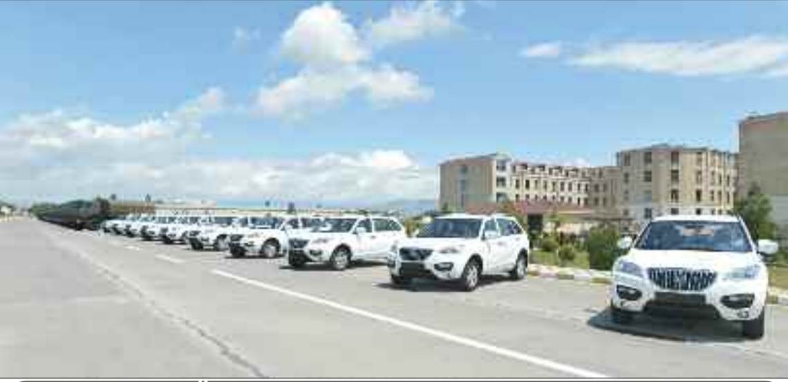
Əlahiddə Ümumqoşun Ordusunun hissə və bölmələrinə verilmiş yeni xidməti avtomobillər