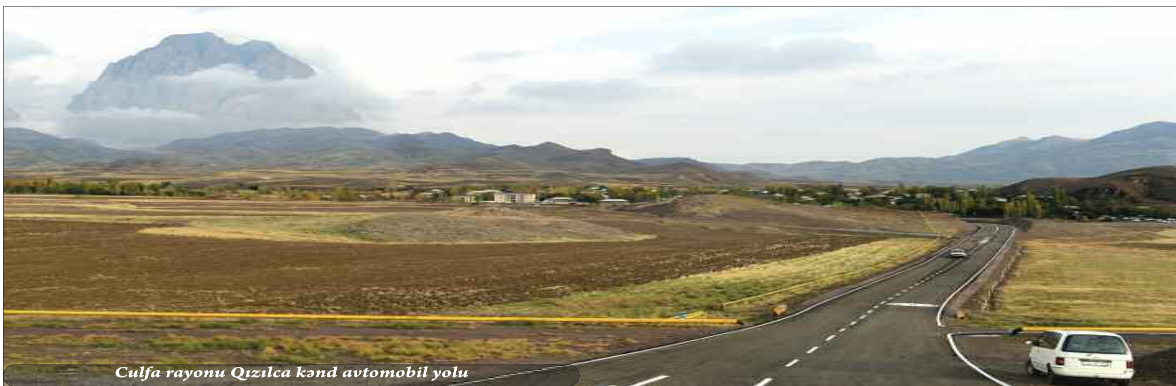
Culfa rayonu Qızılca kənd avtomobil yolu