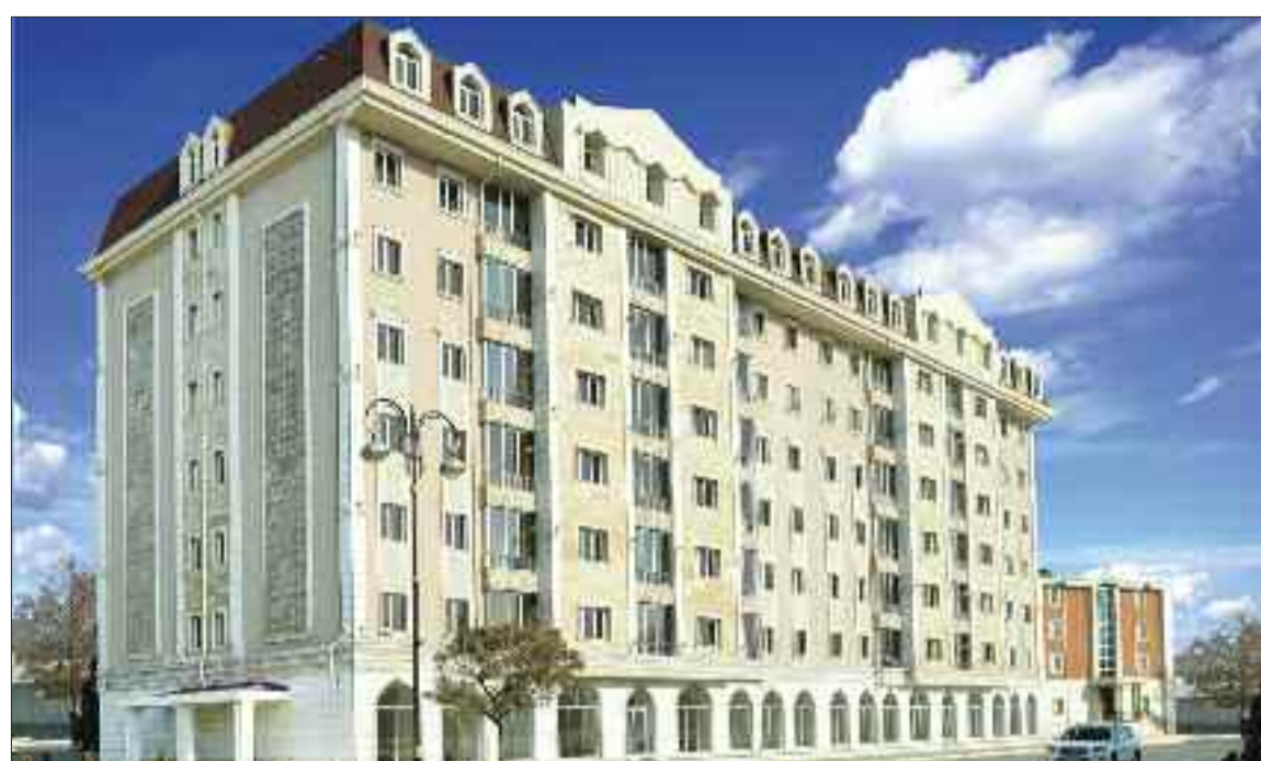
Naxçıvan şəhərinin Atatürk küçəsində 56 mənzilli yaşayış binası