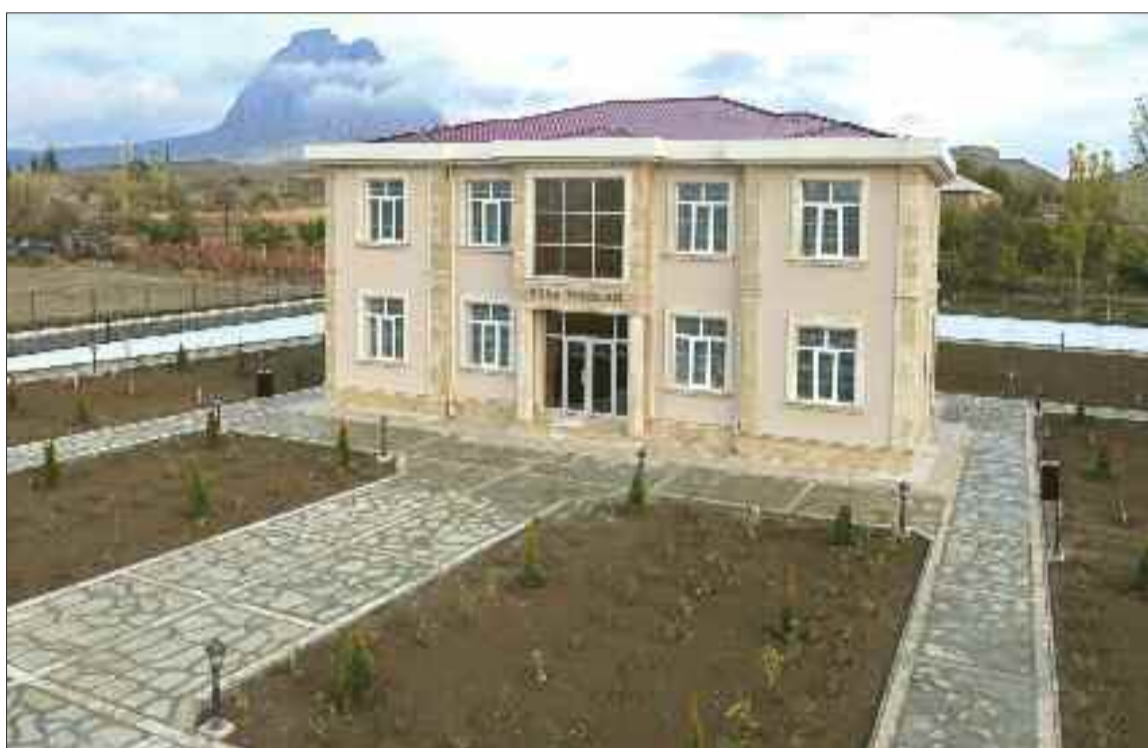
Culfa rayonu Qızılca Kənd Mərkəzi