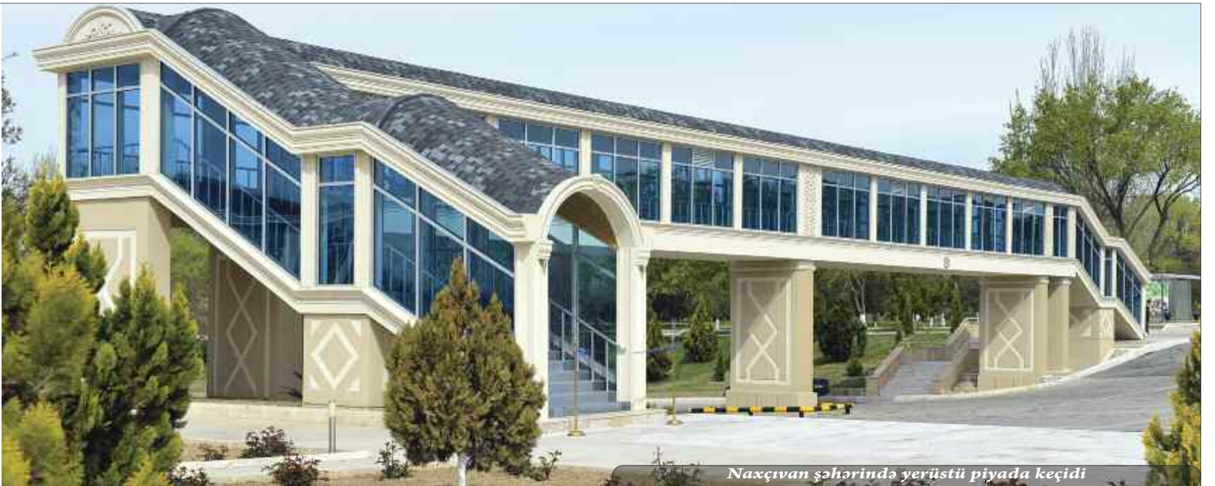
Naxçıvan şəhərində yerüstü piyada keçidi