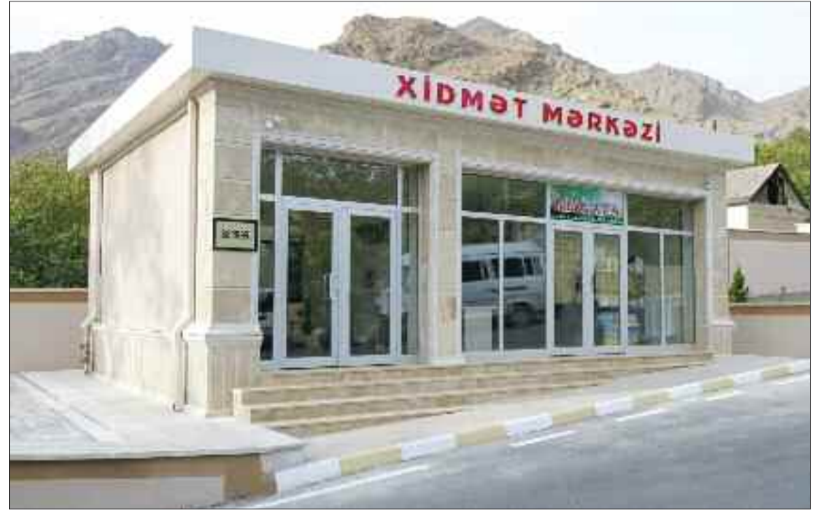
Şərur rayonunun Yuxarı Yaycı kəndində xidmət mərkəzi