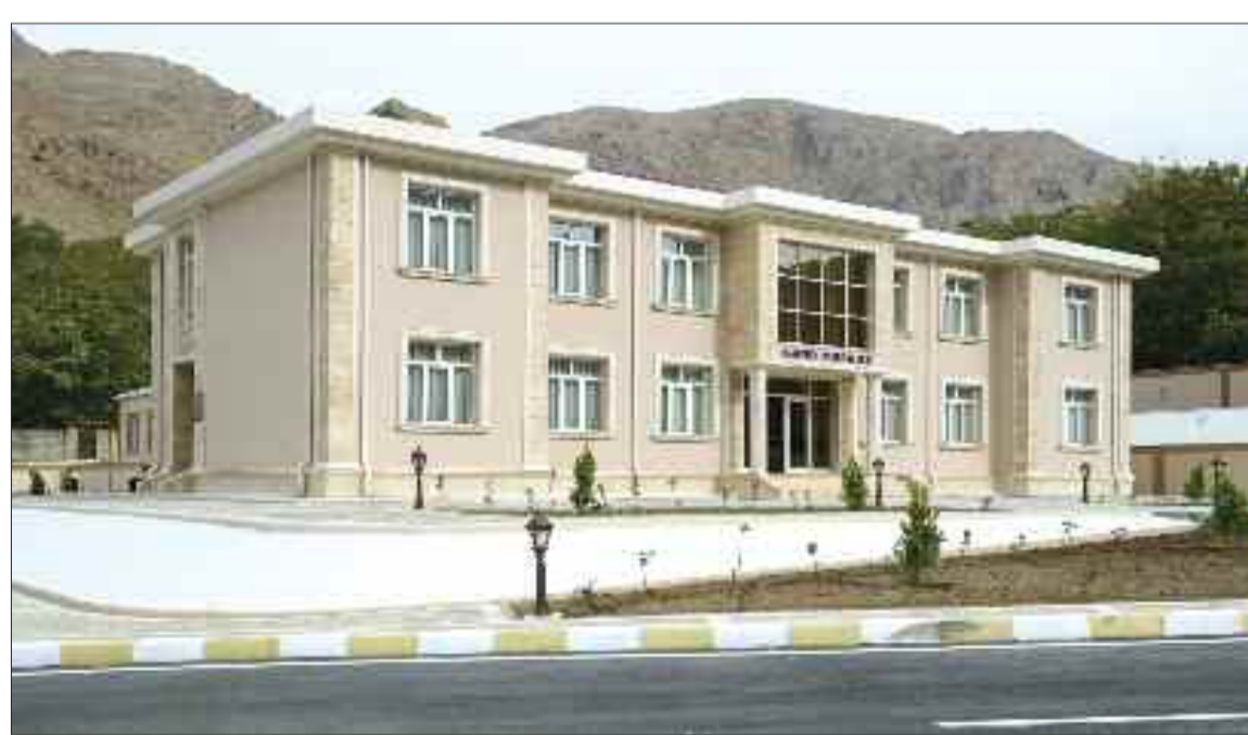
Şərur rayonu Yuxarı Yaycı Kənd Mərkəzi