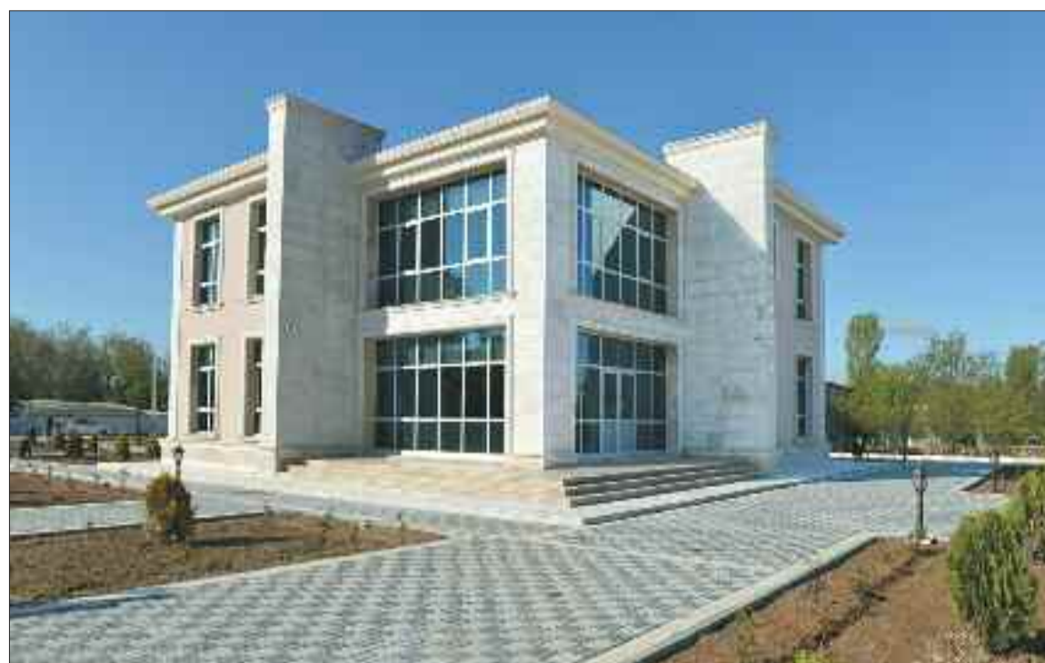
Şərur şəhərində aviakassa binası