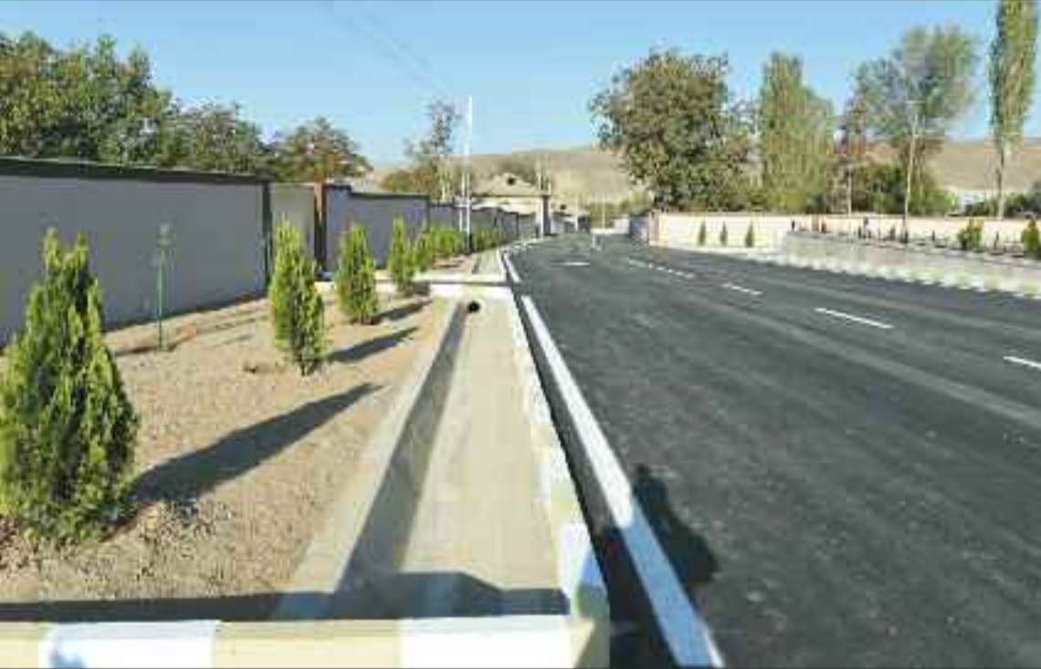
Babək rayonu Xal-xal kənd avtomobil yolu