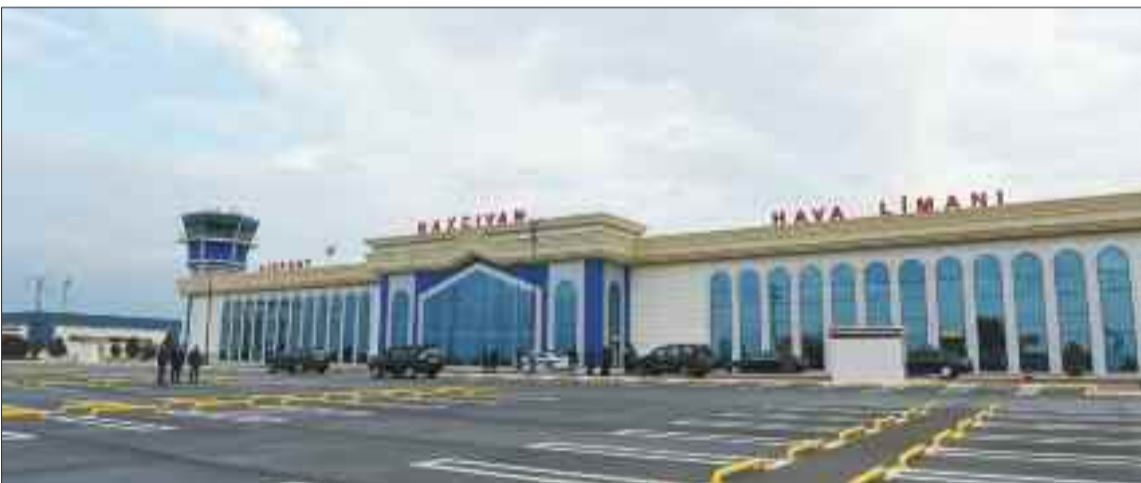
Naxçıvan Beynəlxalq Hava Limanının "Şərq Terminalı"