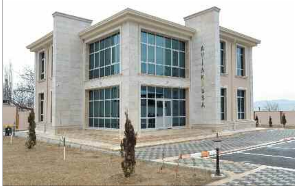
Ordubad şəhərində aviakassa binası