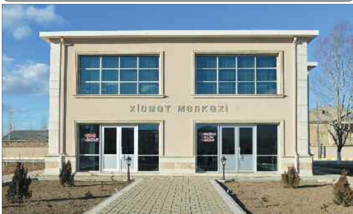
Şərur rayonunun Püsyan kəndində xidmət mərkəzi