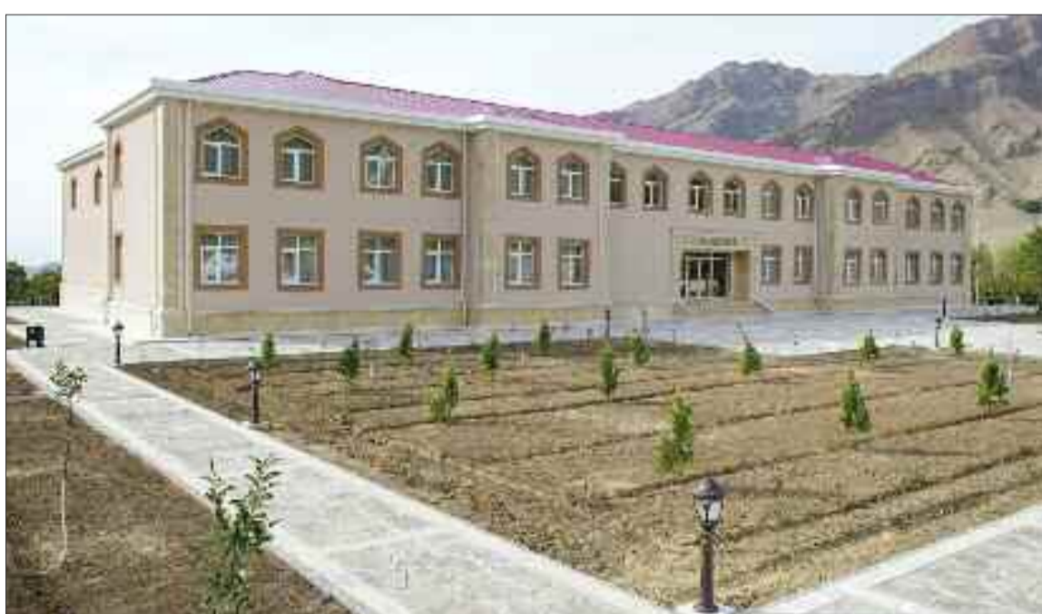
Şərur rayonunun Yuxarı Yaycı kəndində 144 şagird yerlik tam orta məktəb