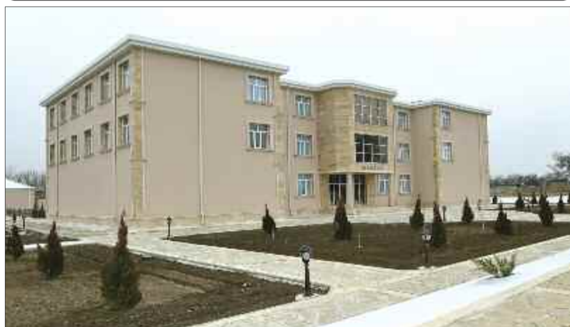
Şərur rayonunun Axaməd kəndində 192 şagird yerlik tam orta məktəb