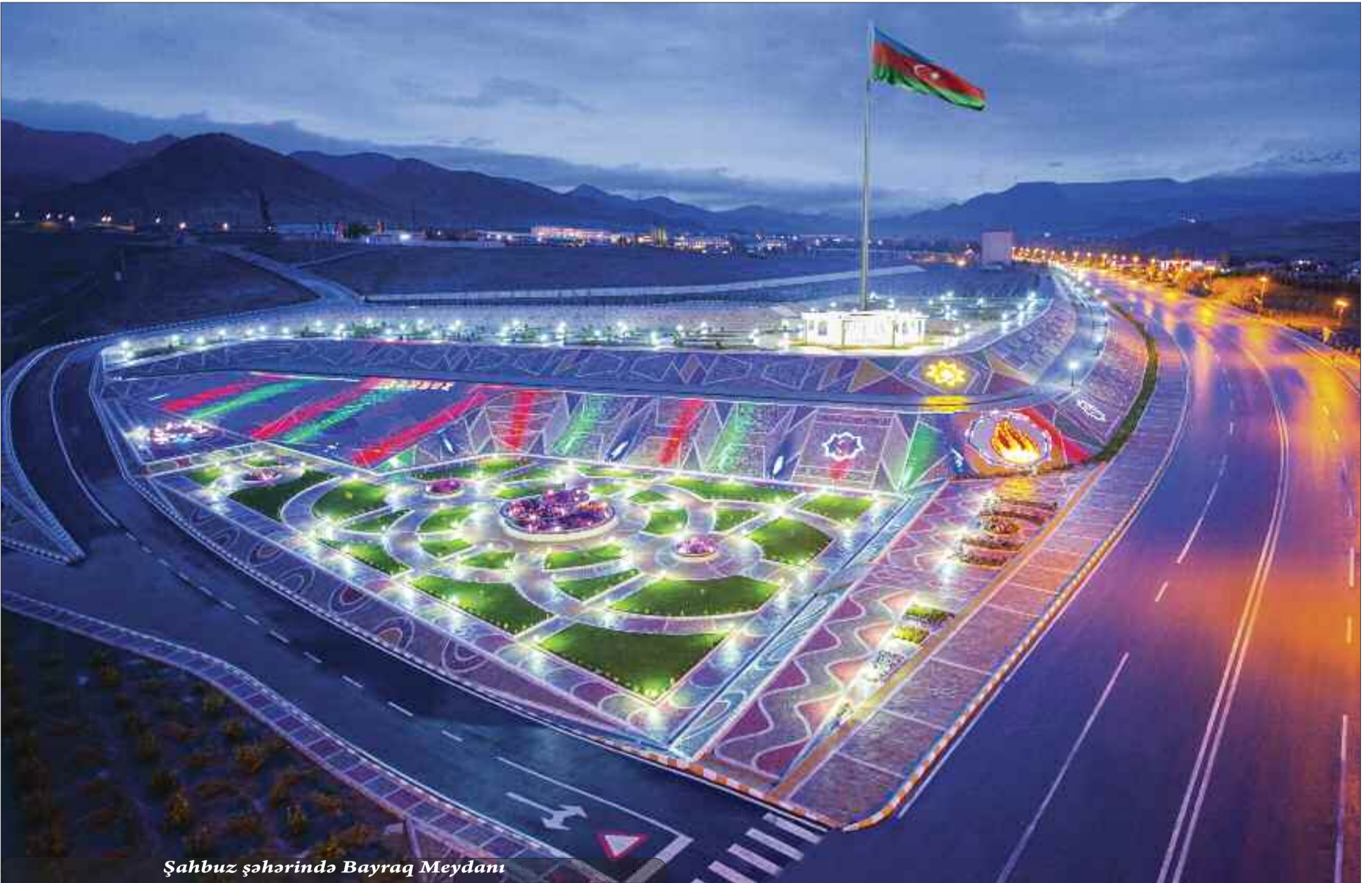
Şahbuz şəhərində Bayraq Meydanı