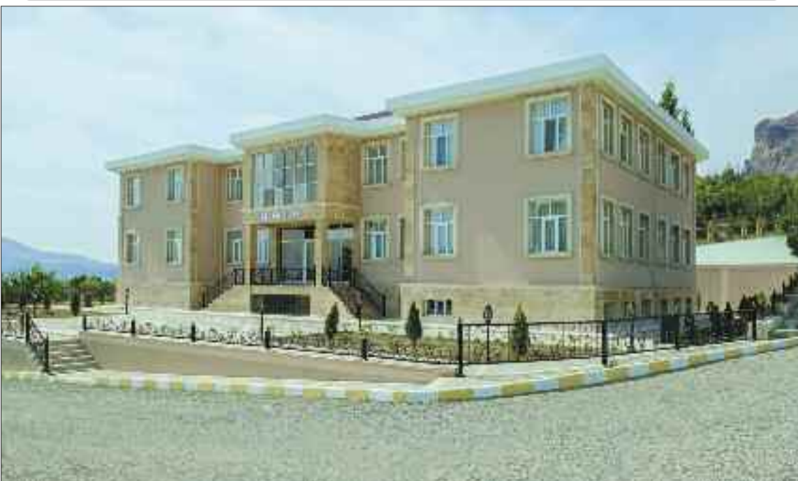
Culfa rayonunun Gal kəndində 96 şagird yerlik tam orta məktəb