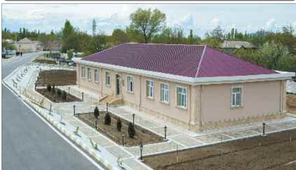
Şərur rayonundakı Cəlilkənddə həkim ambulatoriyası