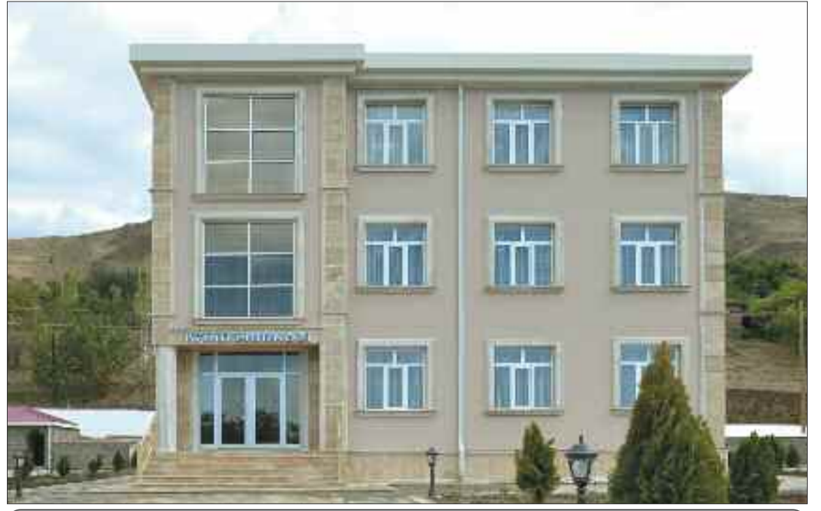
Ordubad rayonu Tivi Kənd Mərkəzi