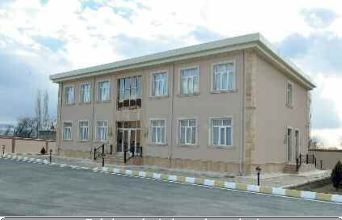
Babək qəsəbəsində qəsəbə mərkəzi