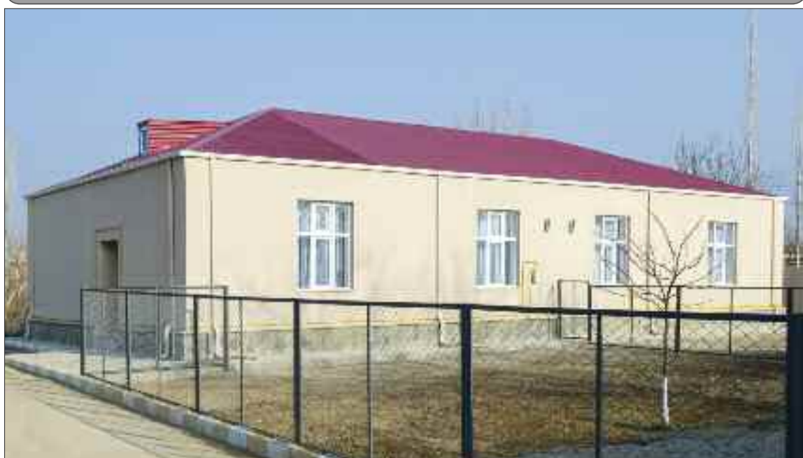
Sosial qayğıya ehtiyacı olanlara verilmiş fərdi ev (8 fərdi ev, 2 yaşayış mənzili)