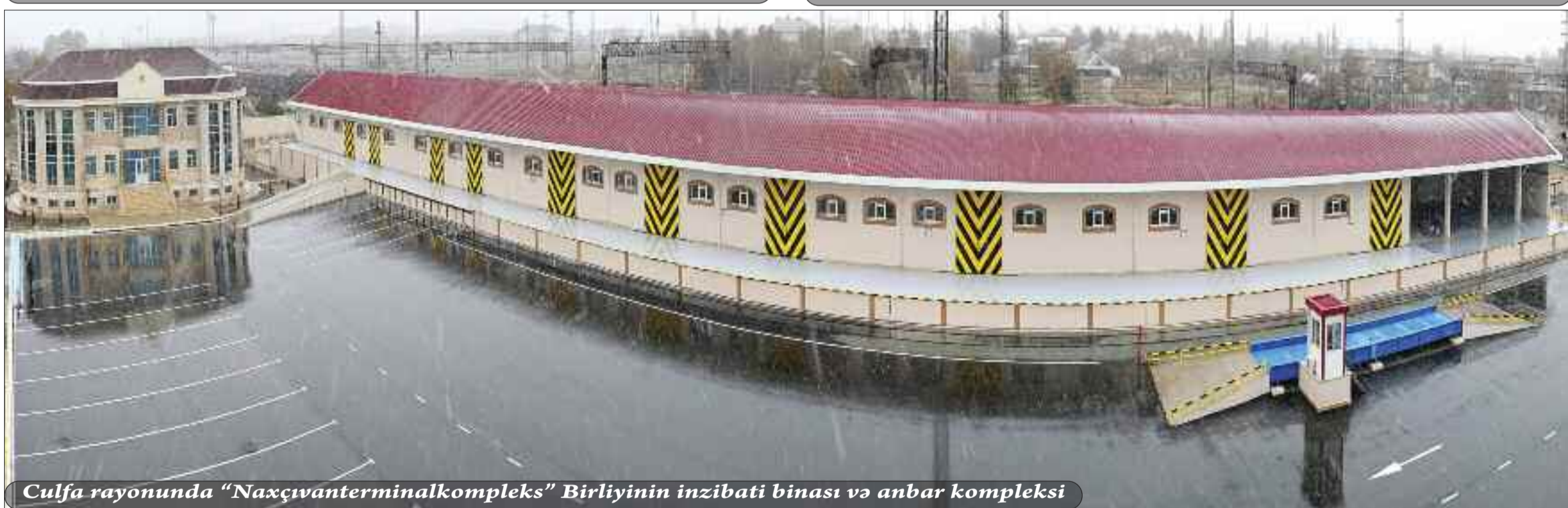
Culfa rayonunda "Naxçıvanterminalkompleks" Birliyinin inzibati binası və anbar kompleksi