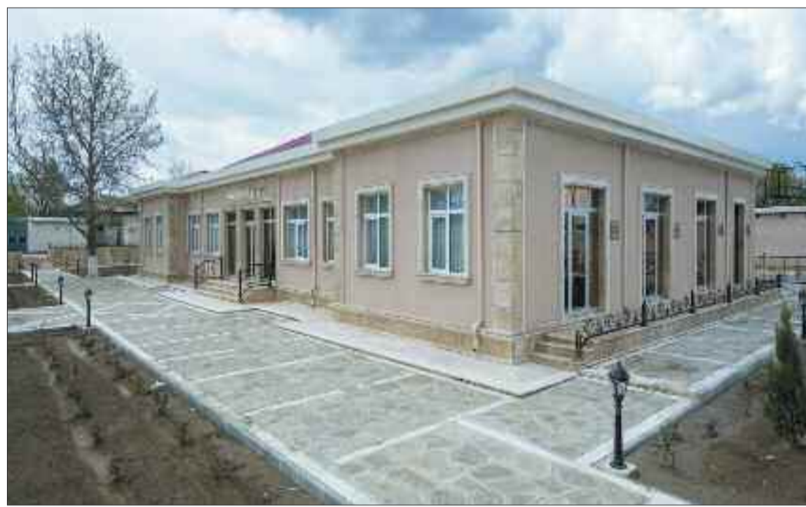
Şərur rayonundakı Çalilkənddə mədəniyyət evi