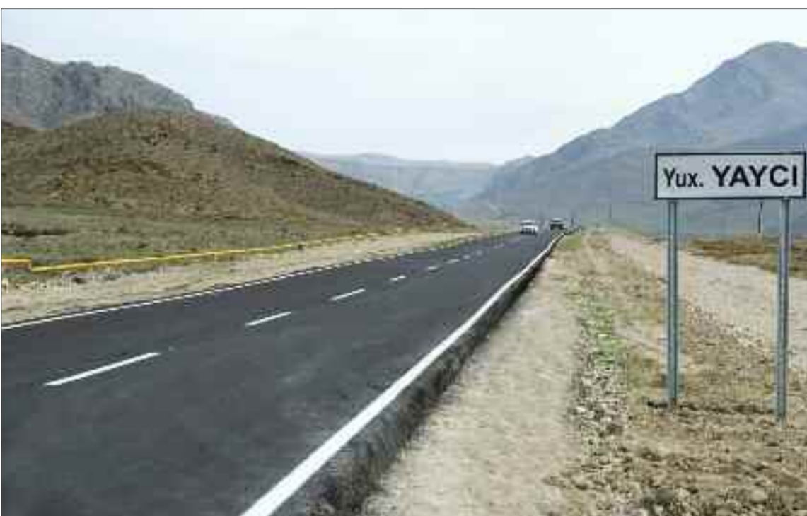
Şərur rayonu Yuxarı Yaycı kənd avtomobil yolu