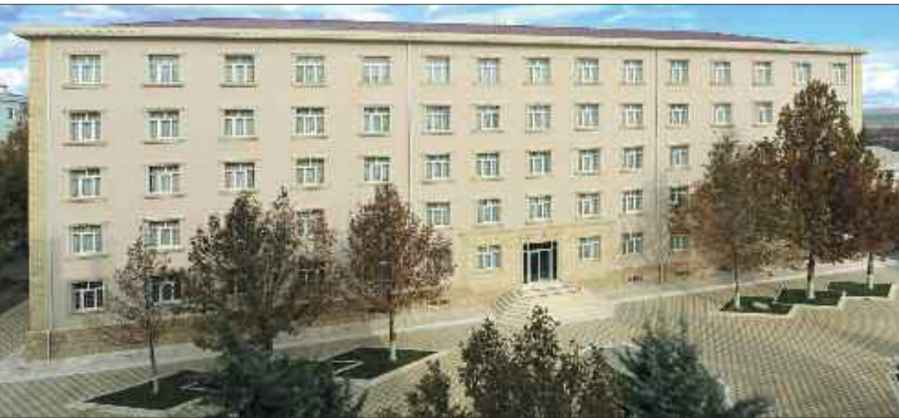
Naxçıvan Musiqi Kolleci