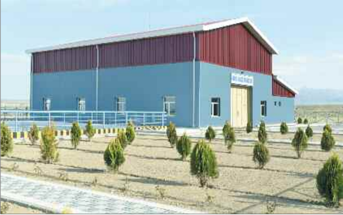
Kəngərli rayonunda yeni nasos stansiyası