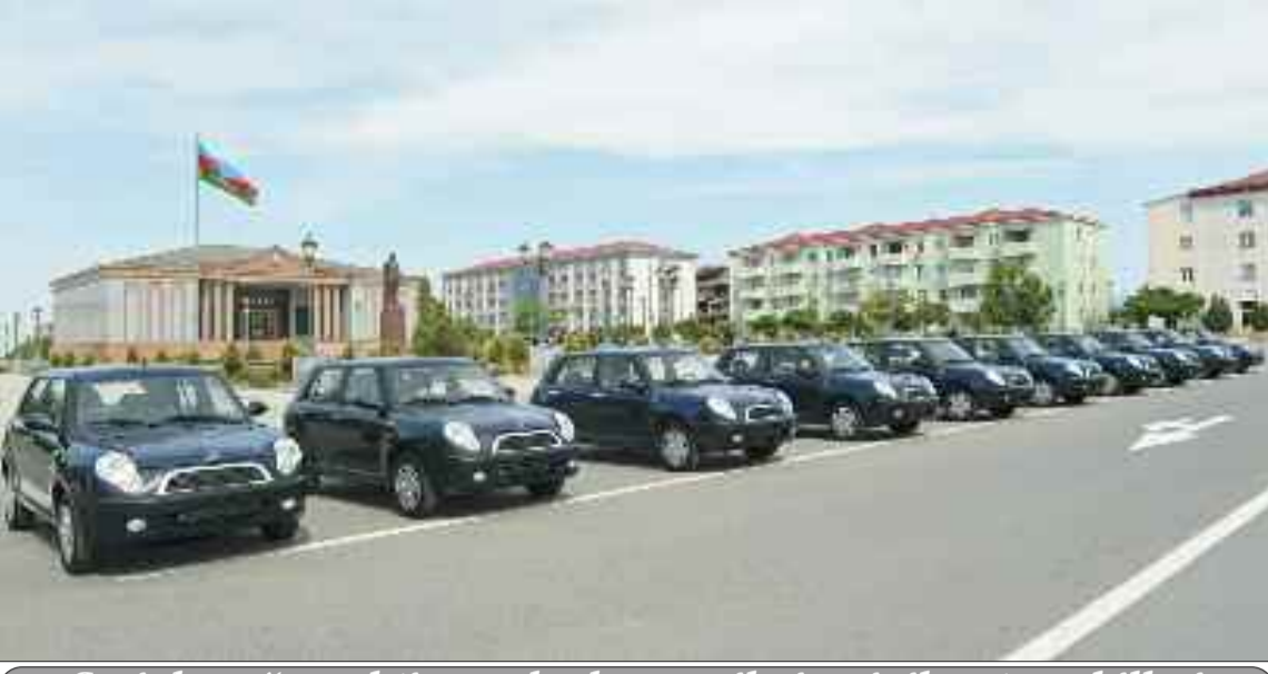
Sosial qayğıya ehtiyacı olanlara verilmiş minik avtomobilləri