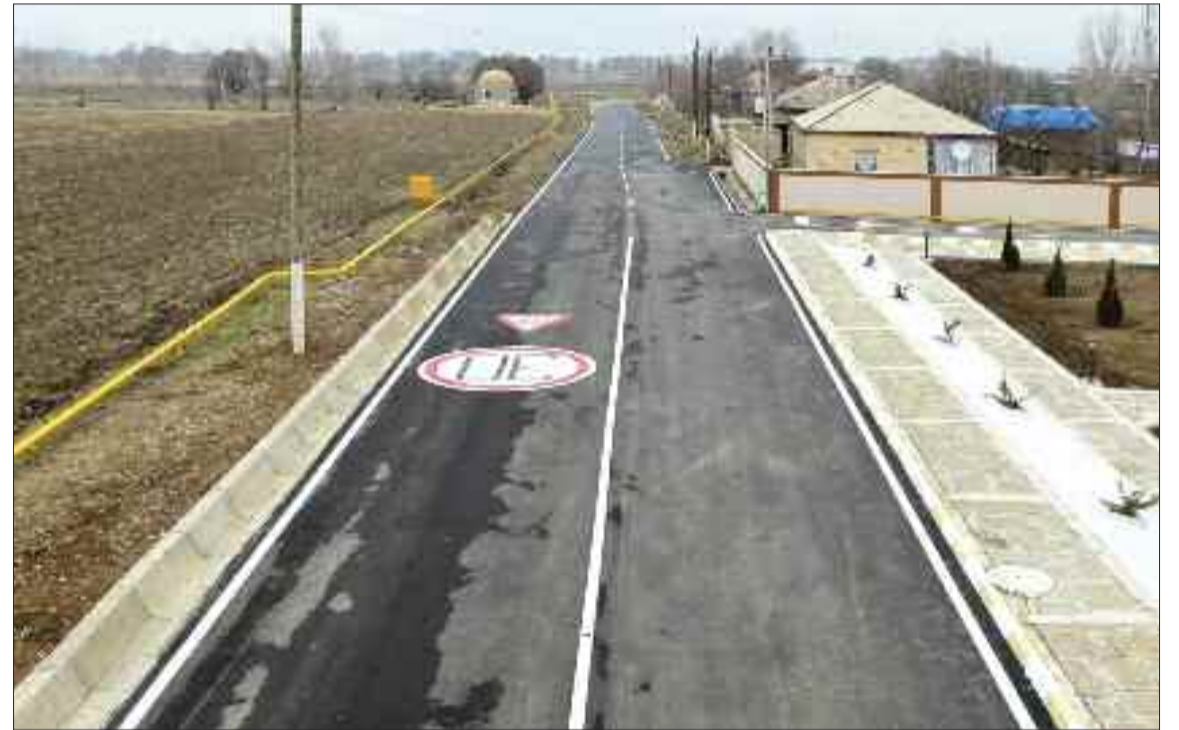
Şərur rayonu Axaş kənd avtomobil yolu