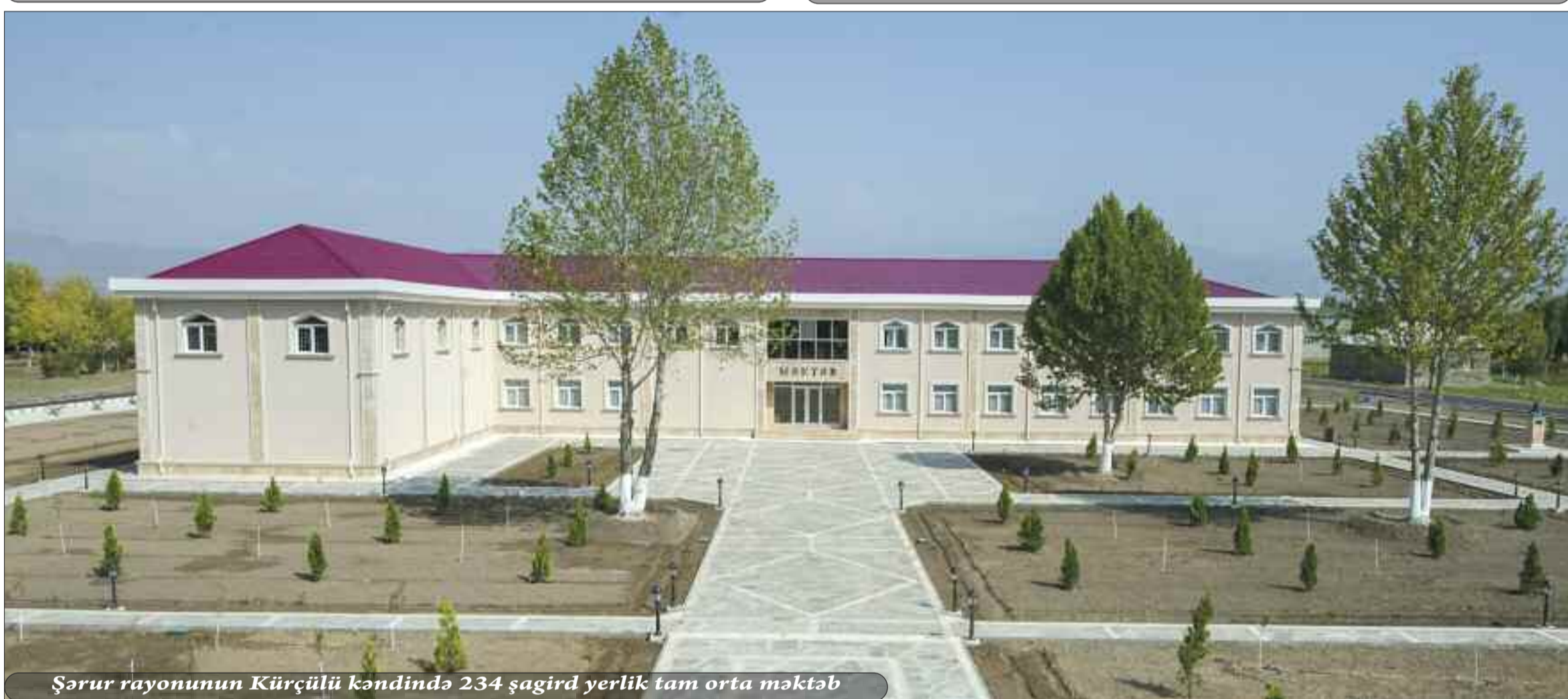
Şərur rayonunun Kürçülü kəndində 234 şagird yerlik tam orta məktəb