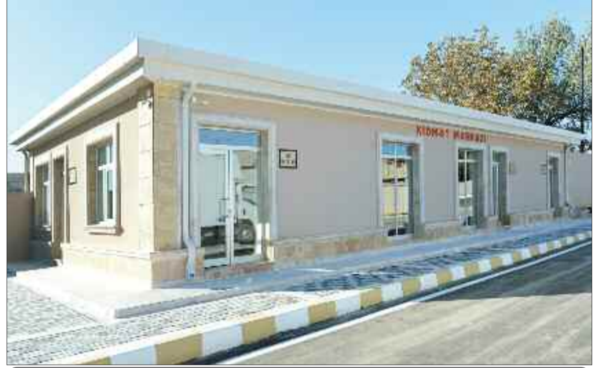
Babək rayonunun Xal-xal kəndində xidmət mərkəzi