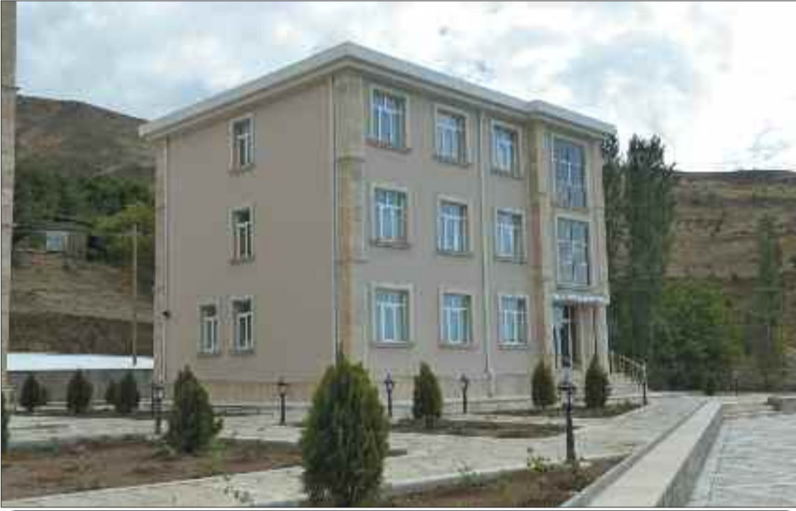
Ordubad rayonunun Tivi kəndində həkim ambulatoriyası