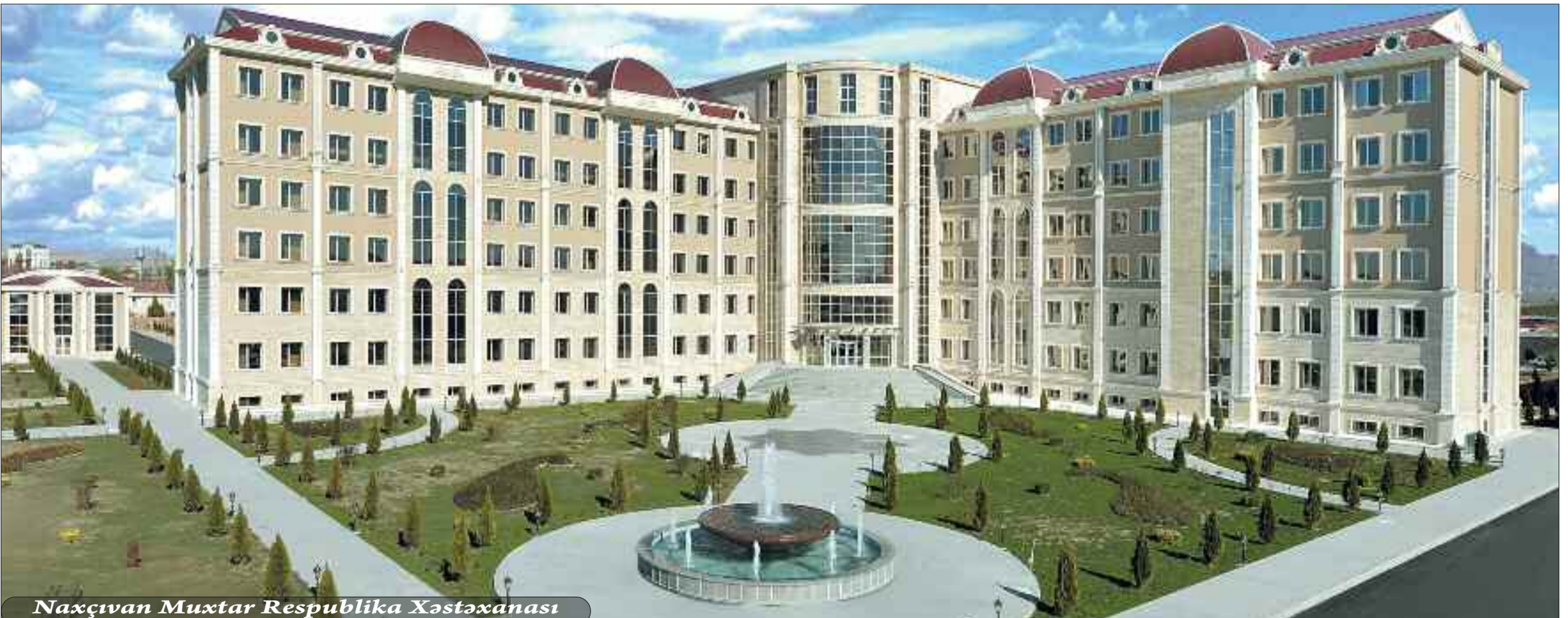
Naxçıvan Muxtar Respublika Xəstəxanası