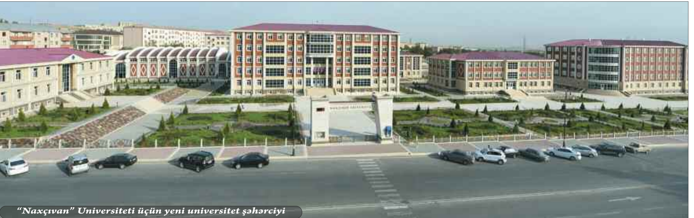
"Naxçıvan" Universiteti üçün yeni universitet şəhərciyi