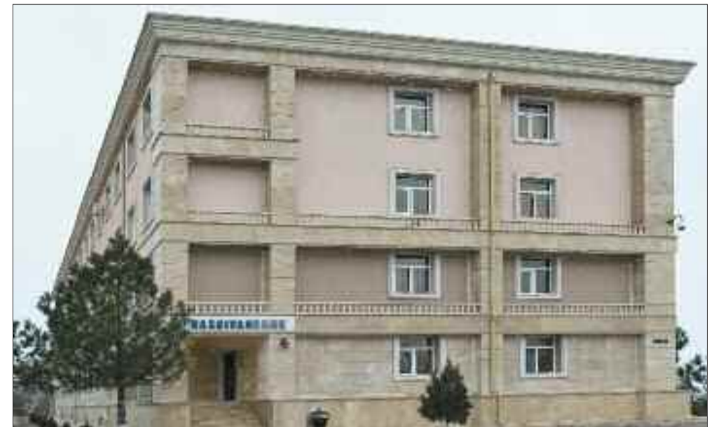
"Naxçıvanbank" Açıq Səhmdar Cəmiyyətinin Naxçıvan şəhər filialı