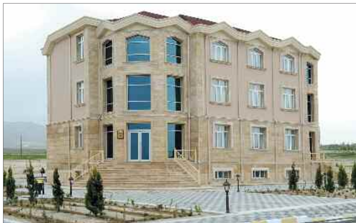
Kəngərli Rayon Təhsil Şöbəsinin inzibati binası