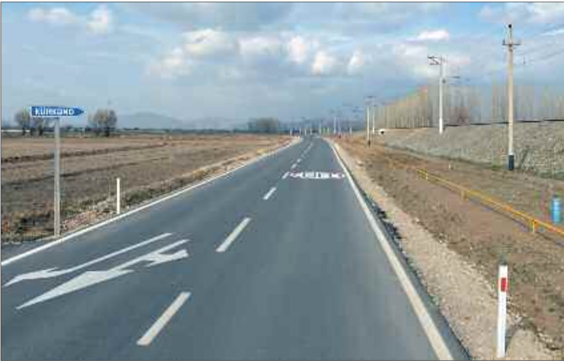
Şərur şəhər – Kürəkənd avtomobil yolu