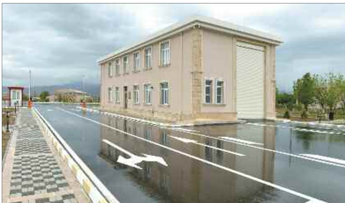
Naxçıvan Muxtar Respublikası Daxili İşlər Nazirliyinin Dövlət Yol Polisi İdarəsinin Culfa Rayon Avtomobillərin Müayinə Mərkəzi