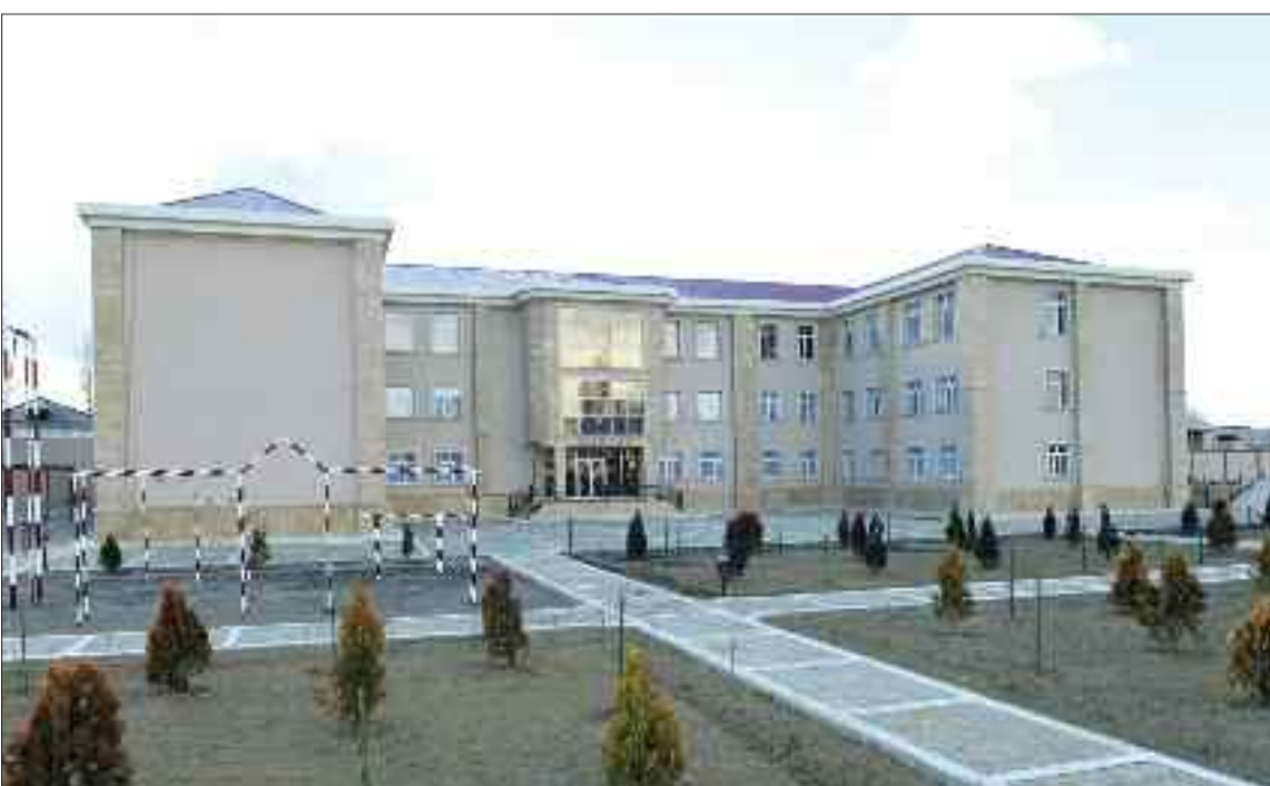
Babək qəsəbəsində 360 şagird yerlik tam orta məktəb