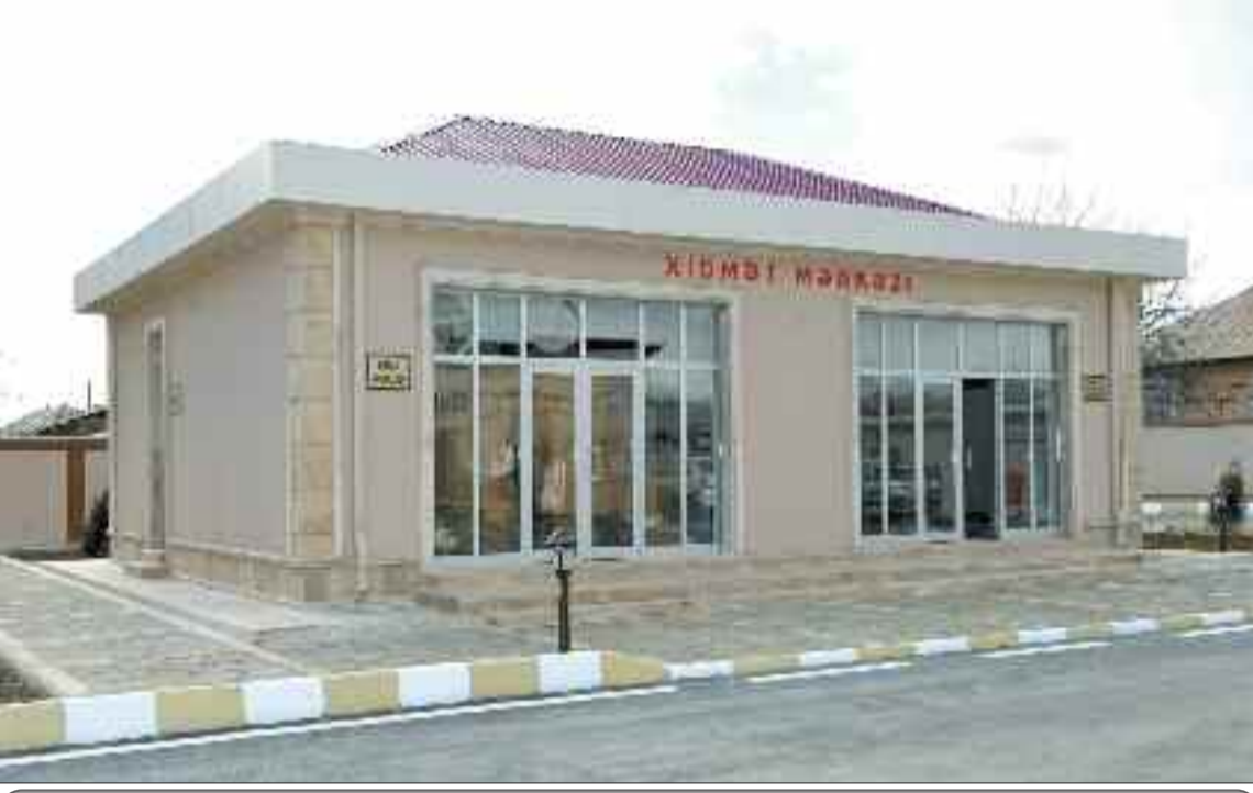
Babək qəsəbəsində xidmət mərkəzi