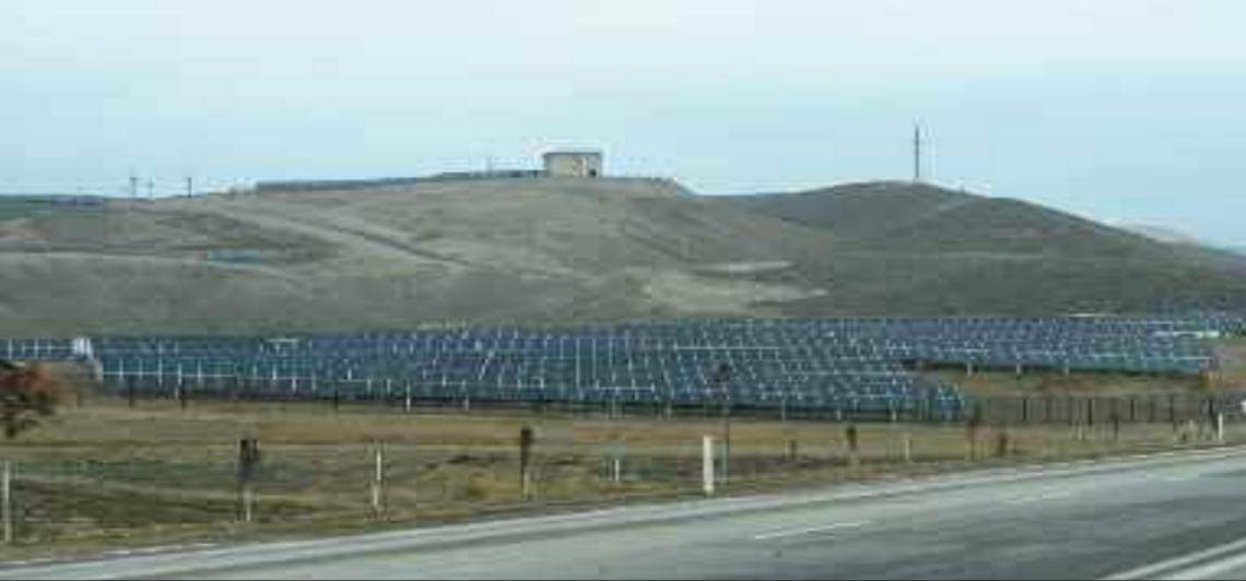
20 mVt gücündə Naxçıvan Günəş Elektrik Stansiyası