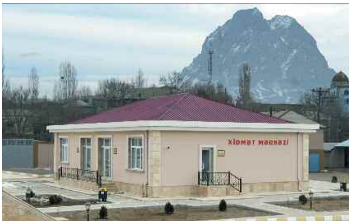
Culfa rayonunun Bənəniyar kəndində xidmət mərkəzi