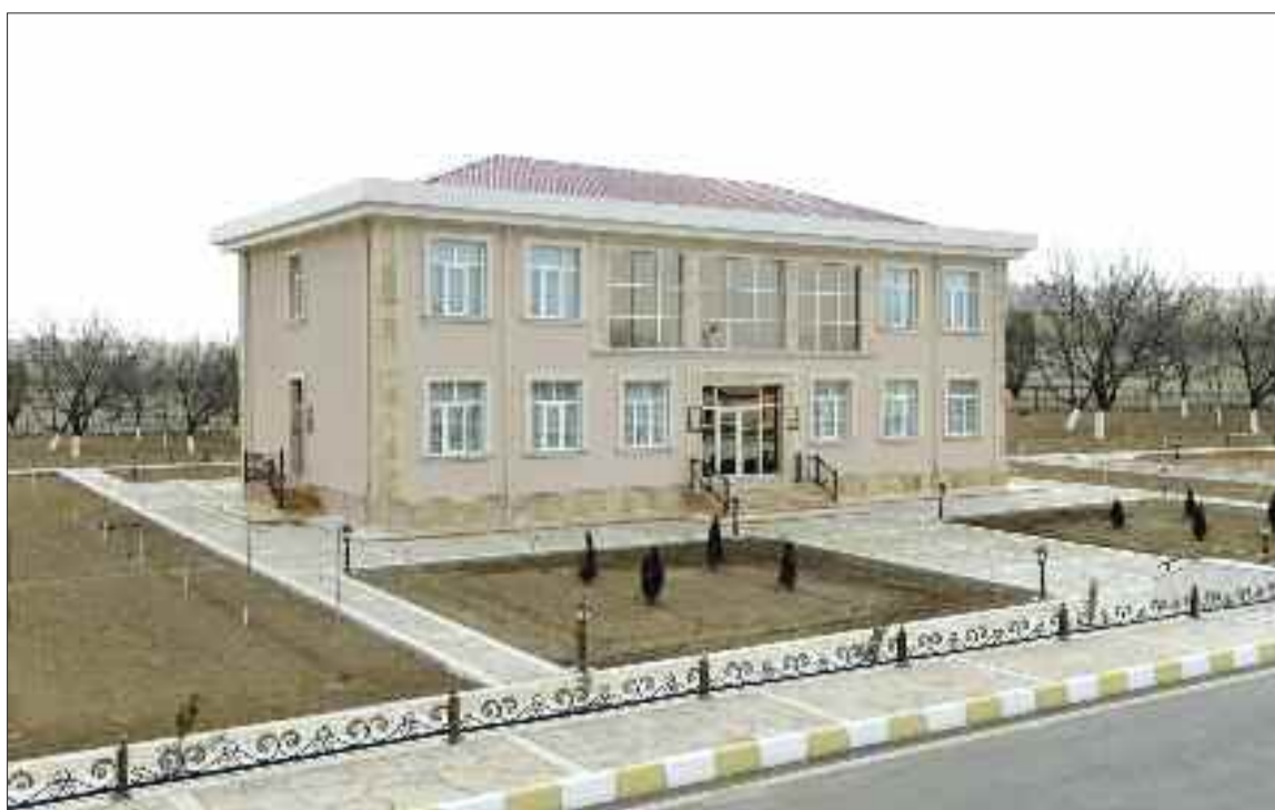
Şərur rayonu Kürkənd Kənd Mərkəzi