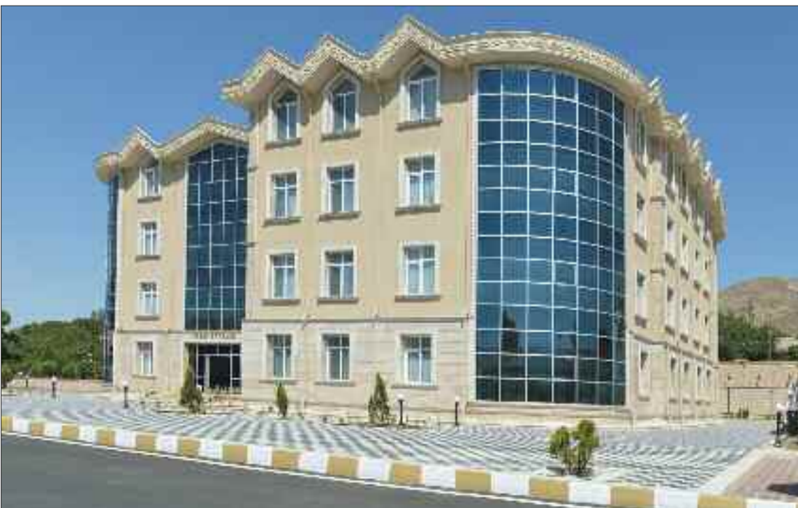
242 yerlik Şahbuz şəhər uşaq bağçası