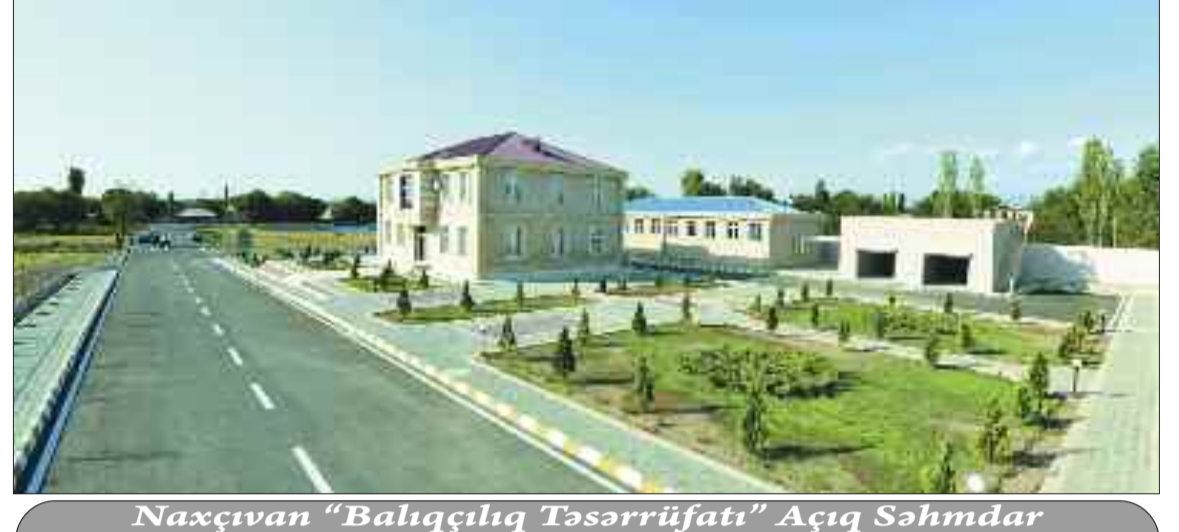
Naxçıvan "Balıqçılıq Təsərrüfatı" Açıq Səhmdar Cəmiyyətinin yeni inzibati və təsərrüfat binaları