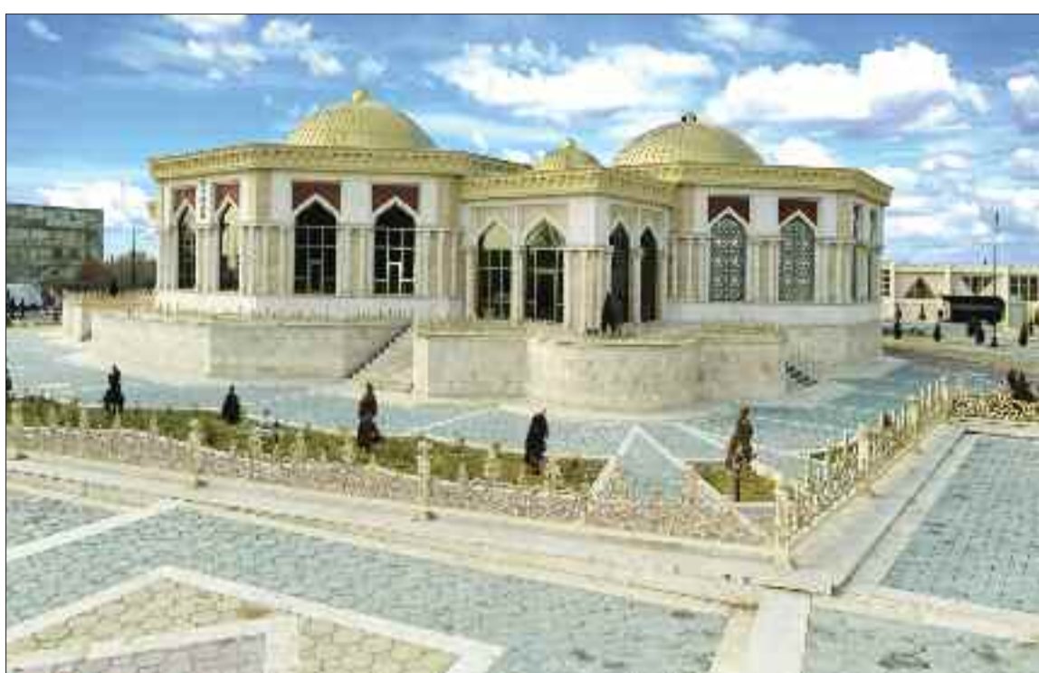
Naxçıvan şəhərində Şərq hamamı