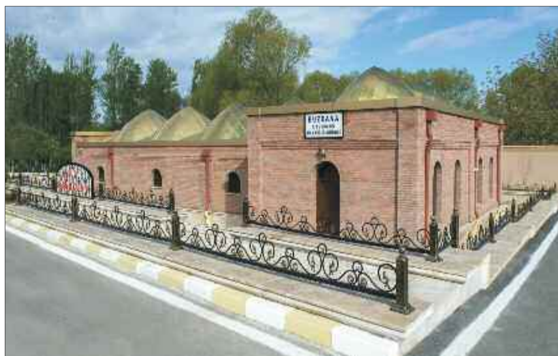
Şərur rayonundakı Çalilkənddə tarixi Buzxana abidəsi