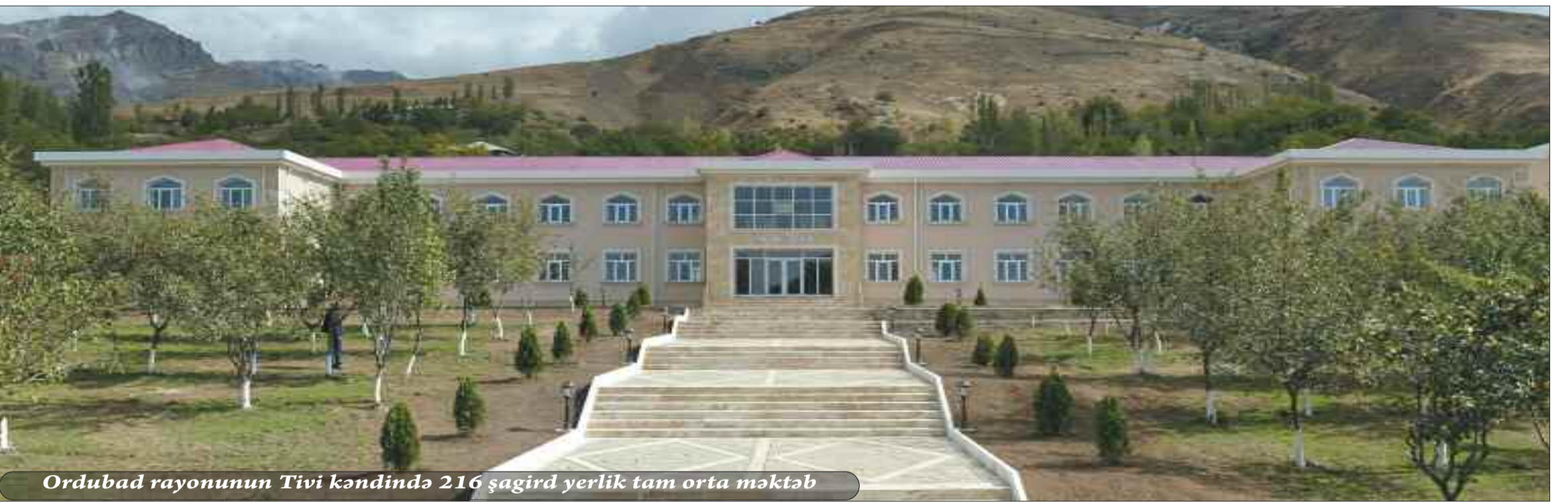
Ordubad rayonunun Tivi kəndində 216 şagird yerlik tam orta məktəb