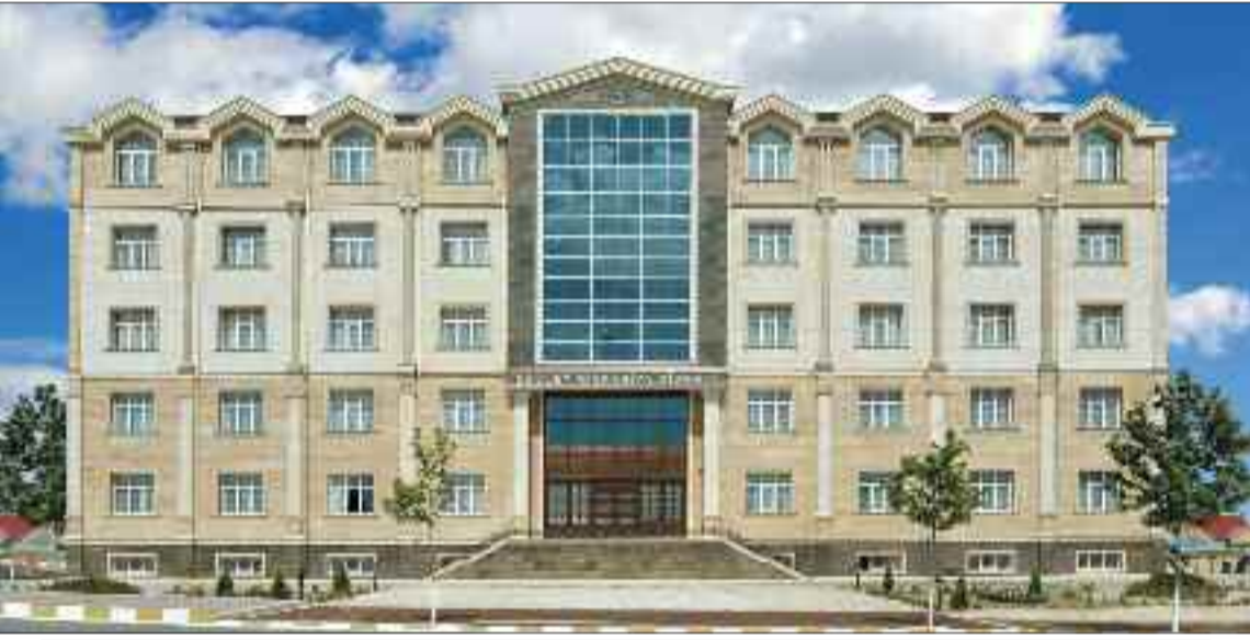
Naxçıvan Muxtar Respublikası Dövlət Miqrasiya Xidmətinin inzibati binası