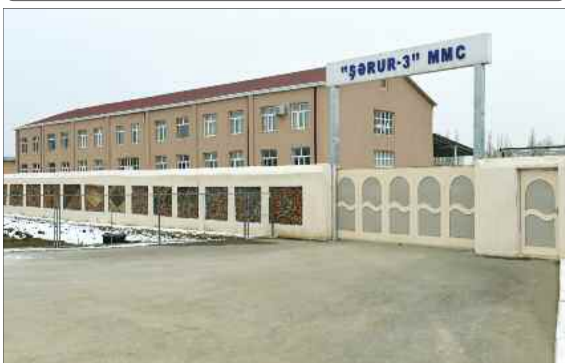
"Şərur-3" MMC-nin yeni istehsal sahəsi