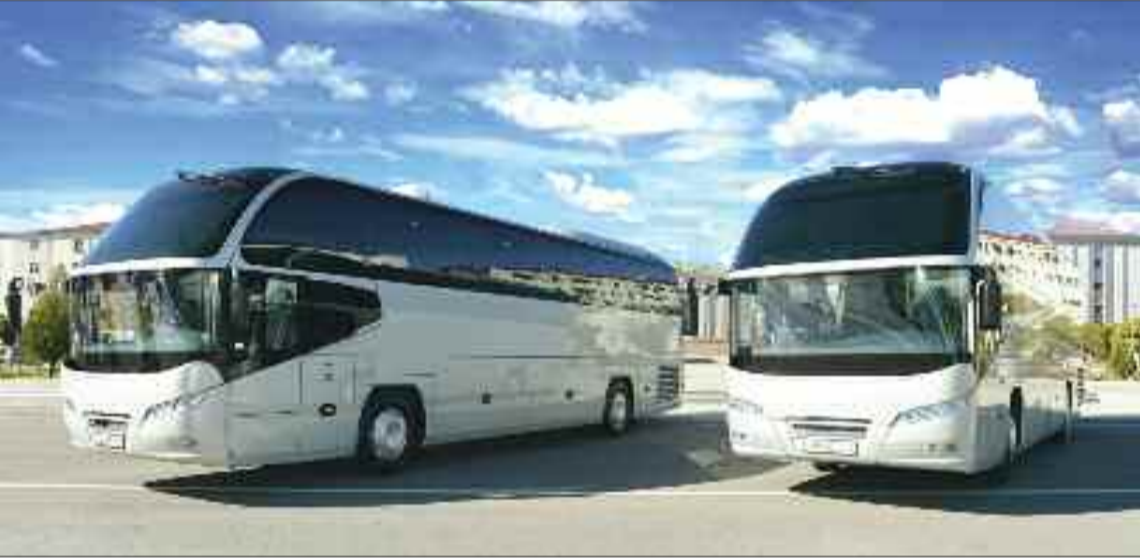
Naxçıvan Şəhər Nəqliyyat İdarəsinə beynəlxalq sərnişindaşıma üçün alınmış yeni avtobuslar