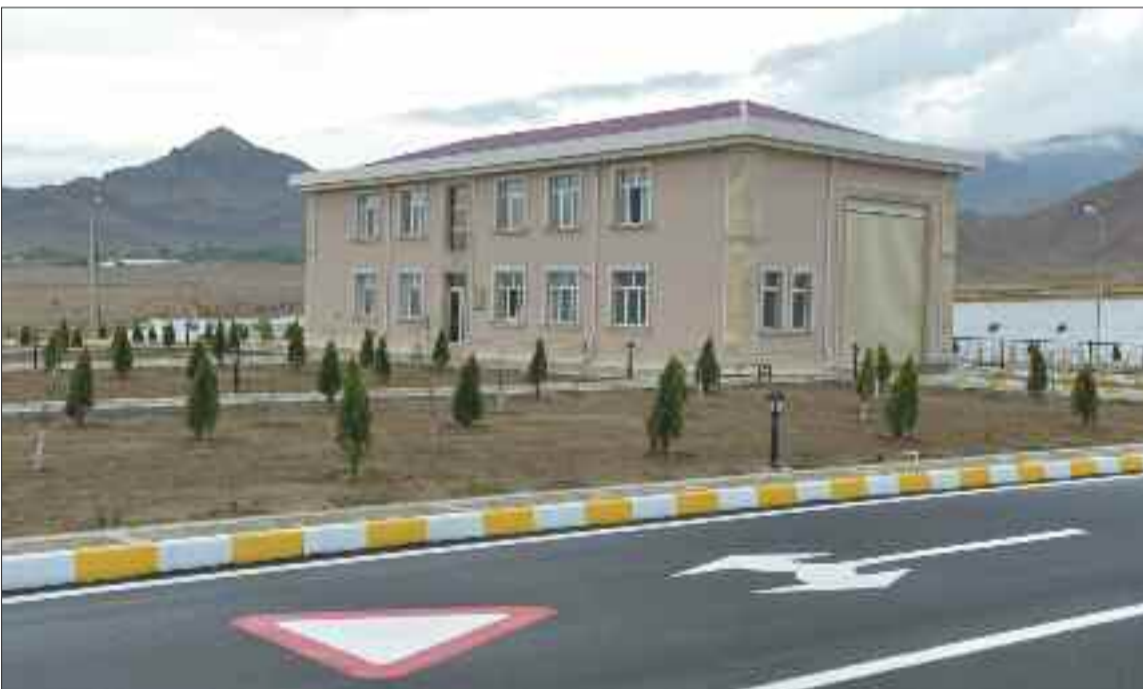
Naxçıvan Muxtar Respublikası Daxili İşlər Nazirliyinin Dövlət Yol Polisi İdarəsinin Ordubad Rayon Avtomobillərin Müayinə Mərkəzi